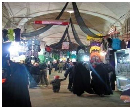
شکل ۳. بخشی از میدان امام علی (ع) پیش از احیا

https://www.yjc.news/ Fig. 4. Part of Imam Ali (AS) Square after revival