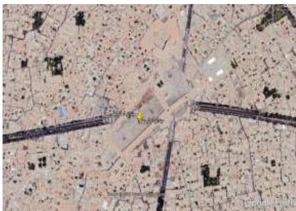
شکل ۲. محدوده میدان در سال ۱۴۰۰ Fig. 2. Area of Square in 2021

در جریان تهیه طرح جامع شهر اصفهان توسط مهندسين مشاور نقش جهان پارس به‌طور جدی مطرح شد (مهندسين مشاور نقش جهان پارس، ۱۳۸۸). طرح احیای میدان عتیق که بعداً در سال ۱۳۸۷ سازمان نوسازی و بهسازی شهرداری اصفهان آن را کلید زد، نمونه‌ای بارز از اقدامات بازآفرینی در شهر اصفهان به شمار می‌رود. این طرح اهداف متعددی دارد؛ اهداف کلان آن تقویت نقش تاریخی، فرهنگی و گردشگری این محدوده در شهر اصفهان، اعتلای کیفیت زندگی اجتماعی و افزایش کارایی و بهره‌وری زمین در محدوده طرح است. شکل ۱ و ۲ محدوده میدان عتیق را پیش و پس از بازآفرینی نشان می‌دهد.