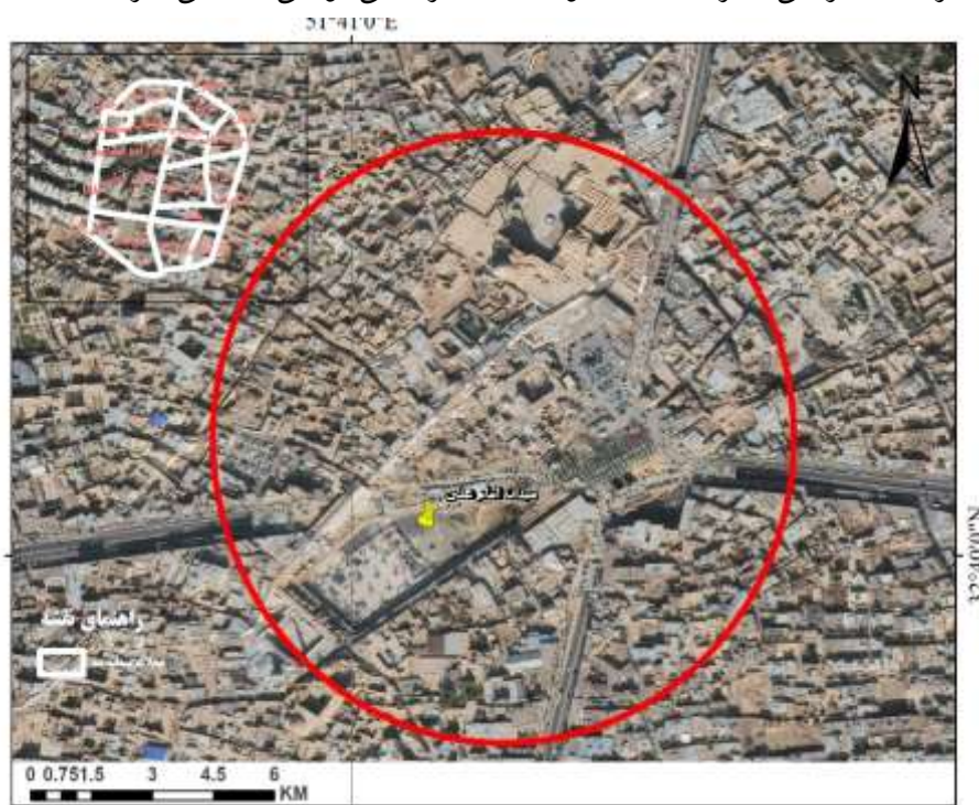
شکل ۵. موقعیت مجموعه میدان امام علی (ع) در منطقه سه شهر اصفهان

میدان امام علی (ع) و مجموعه احداث‌های اطراف آن وسعتی برابر با ۳۲,۵ هکتار دارد. این مجموعه در منطقه سه شهرداری اصفهان قرار گرفته است. منطقه ۳ شهرداری اصفهان وسعتی برابر با ۱۱۰۰ هکتار و جمعیتی برابر با ۱۱۱۸۱۶ نفر دارد. این منطقه از شرق به خیابان بزرگمهر، از شمال به خیابان‌های سروش و مدرس، از غرب به خیابان چهارباغ عباسی و میدان انقلاب و از جنوب به زاینده‌رود منتهی می‌شود. محدوده طرح خیابان‌های هاتف در جنوب، علامه مجلسی در شمال، ولی عصر در شرق و عبدالرزاق در غرب را قطع می‌کند. در شکل‌گیری و تعریف محدوده طرح میدان امام علی (ع) عناصر شاخصی چون محور بازار، مسجد جامع عتیق، مسجد و مدرسه علمیه کاسه‌گران، مجموعه هارون ولایت، محور هارونیه و مسجد علی مؤثر بوده است. در سال‌های اخیر این پروژه، مهم‌ترین پرهزینه‌ترین پروژه مرمت و طراحی شهری اصفهان بوده است (ابراهیمی بوزانی و فدایی جزی، ۱۳۹۹: ۳۵).