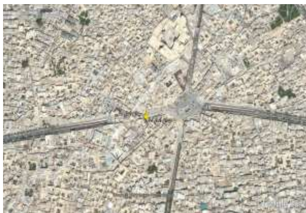
شکل ۱. محدوده میدان در سال ۱۳۸۹ Fig. 1. Area of Square in 2010