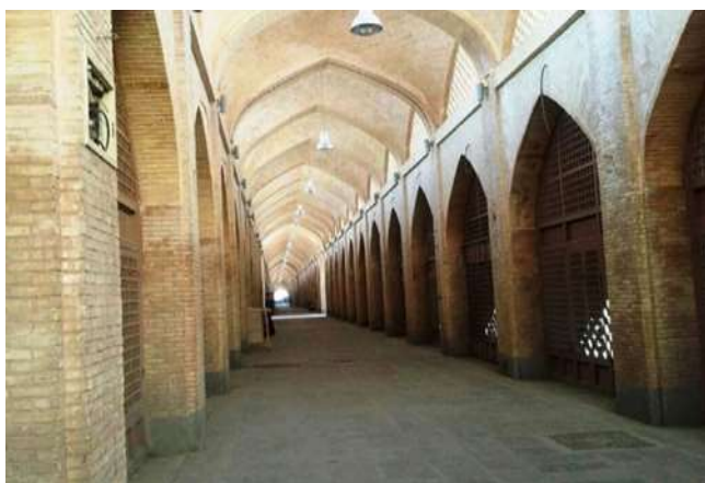
شکل ۴. بخشی از میدان امام علی (ع) پس از احیا