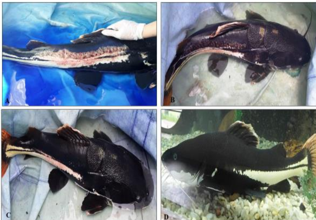
Figura 2. Recuperação da pirara. (A) Dia 14: 5º banho. (B) Dia 20: 6º banho. (C) Dia 28: 7º e último banho. (D) Dia 34: retorno ao aquário de visitação.

No vigésimo oitavo dia de tratamento a lesão estava completamente cicatrizada ( Figura 2 ). Todavia, o animal ficou sob observação no tanque escavado por 72 horas e retornou ao aquário no trigésimo quarto dia em condições físicas e comportamentais normais.