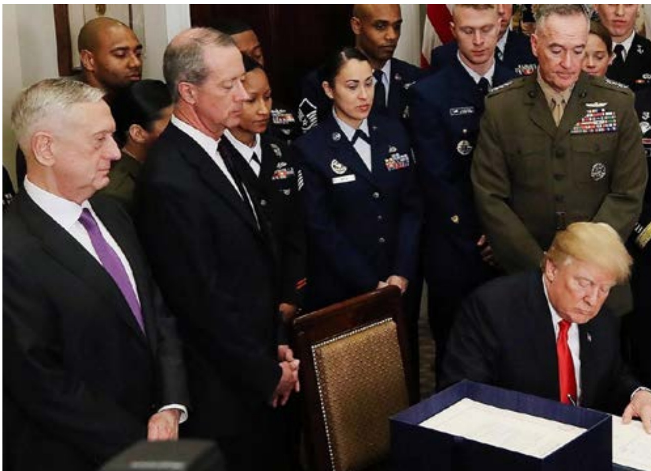
Fig. 1: Firma de la nueva Estrategia de Seguridad Nacional de los Estados Unidos de América por el presidente Donald J. Trump.

Implica además cuestionarse: el unilateralismo como una constante en la política de Estados Unidos; el anticomunismo devenido de la Doctrina Truman, contextualizado en la actualidad al temor de que las izquierdas asuman el poder político de la región, así como la mirada al Sur de sus fronteras, en perenne reinvencción de la Doctrina Monroe.