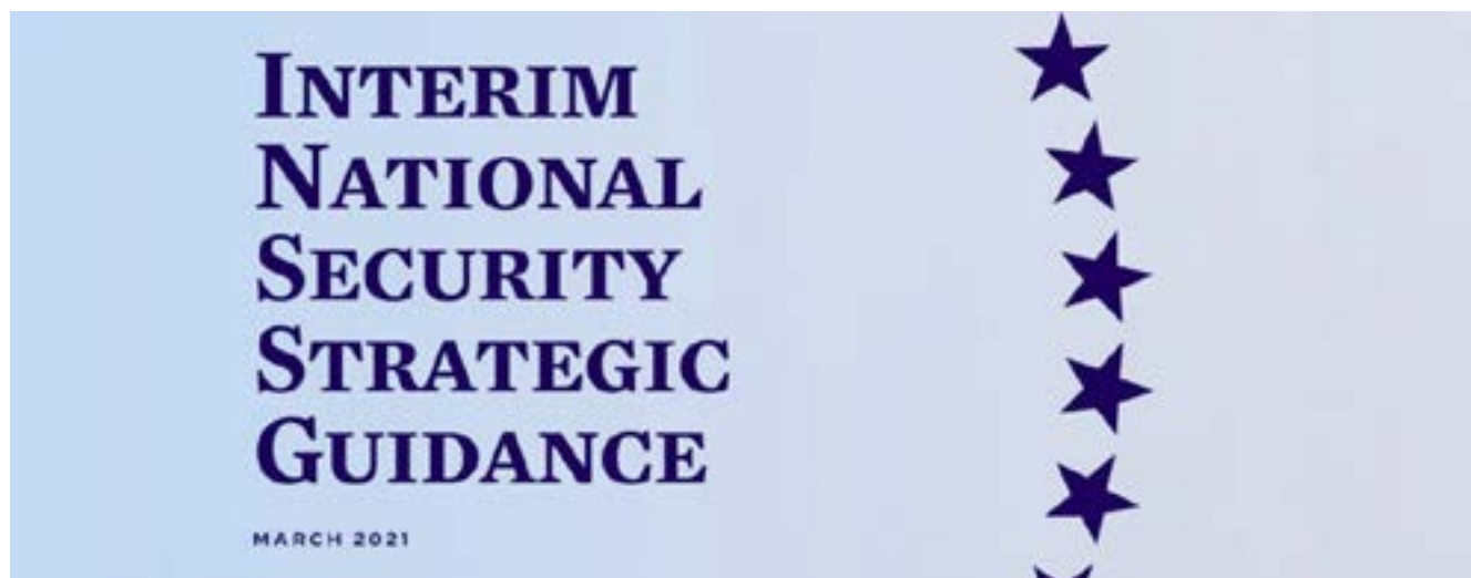
Fig. 2: En marzo de 2021 la Casa Blanca emitió las regulaciones de la Estrategia de Seguridad Nacional transitoria (INSSG por sus siglas en inglés).

bertad y la prosperidad... El mundo tiene su ojo sobre América,