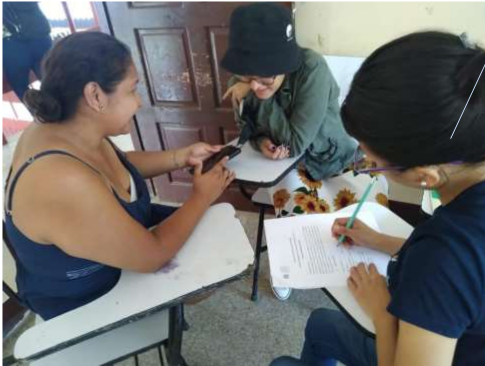
Aplicando entrevista a docente y estudiante en la UNAN, Managua