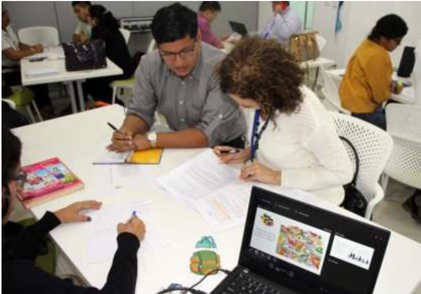
Evidencias de la elaboración del protocolo: tomado de la inadecuada, Página web de la UNICEF

Con el propósito de incluir la reflexión sobre la importancia evitar la migración irregular y proteger a las niñas, niños y adolescentes en todo momento, UNICEF, en coordinación con el Ministerio de la Familia (MIFAN) y organizaciones del