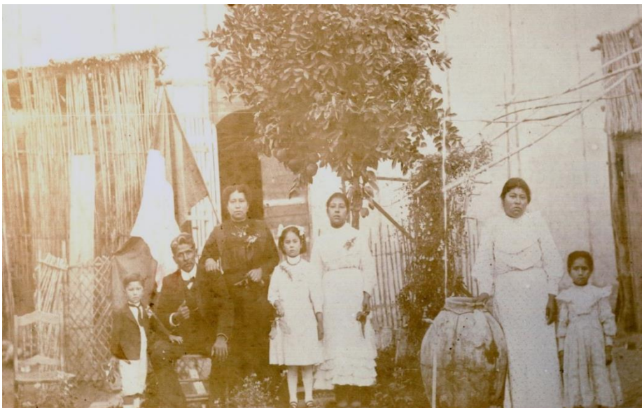
Imagen 2. Familia peruana del poblado de Pica, tras la anexión a Chile de Tarapacá. Fuente: Fotografía cedida por el Sr. Franco Daponte. (Documento de uso público)

A continuación se exponen dos fotografías sobre familias tarapaqueñas peruanas de los sectores del pueblo de Pica y la localidad de Camiña.