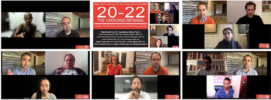
Figura 1. Resumen visual The Ongoing Biennial 20-22 a partir de capturas de pantalla de los diferentes encuentros celebrados.