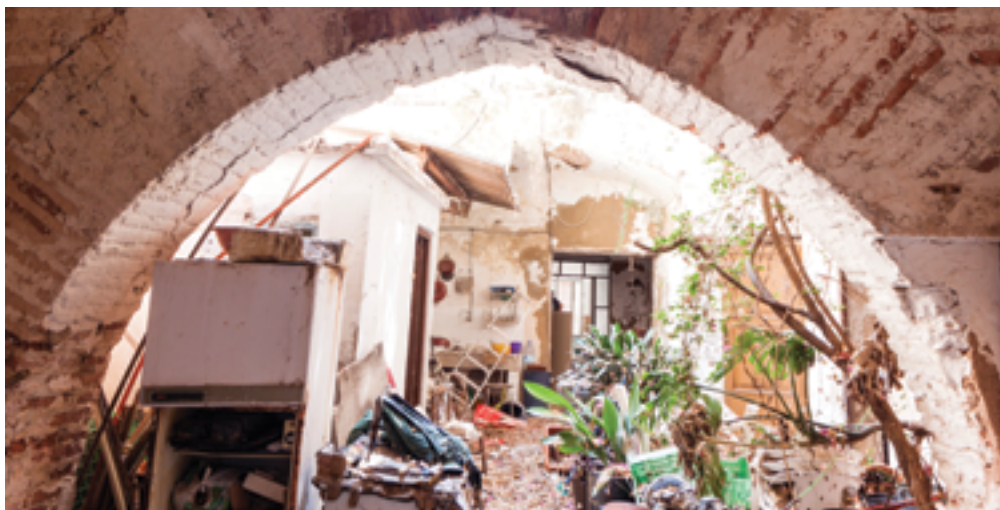
Palau Oliva