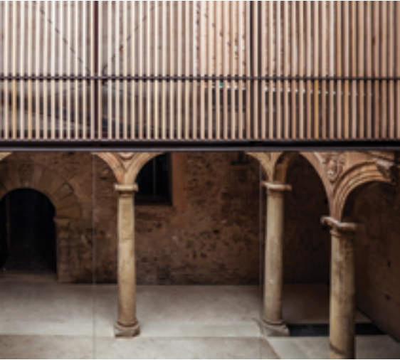
Palau Betxí Fase 1