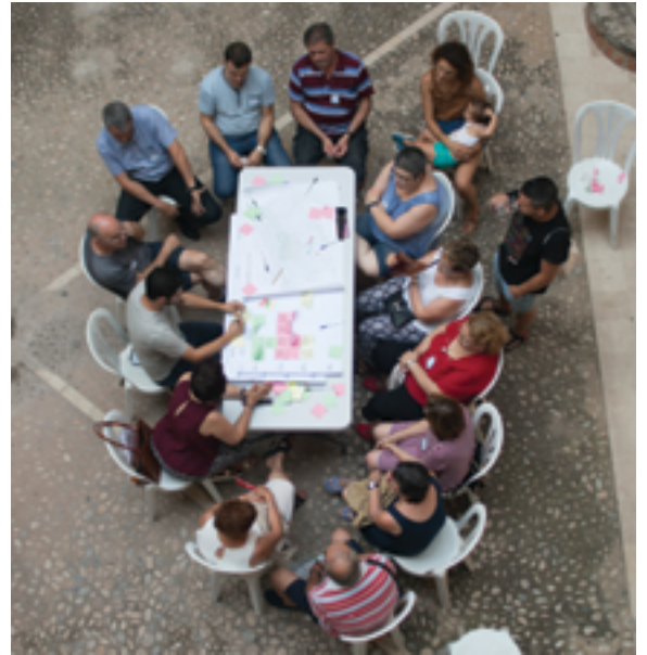
Camí de l'Aigua

«Se trataba de asumir que los centros históricos han de satisfacer las necesidades de la grandísima diversidad de personas (...) que lo habitan, así como de sus condiciones y necesidades particulares a lo largo de su vida en ellos.»