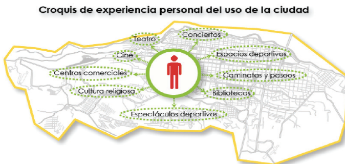
Figura 25. Croquis de experiencia personal en el uso de la ciudad