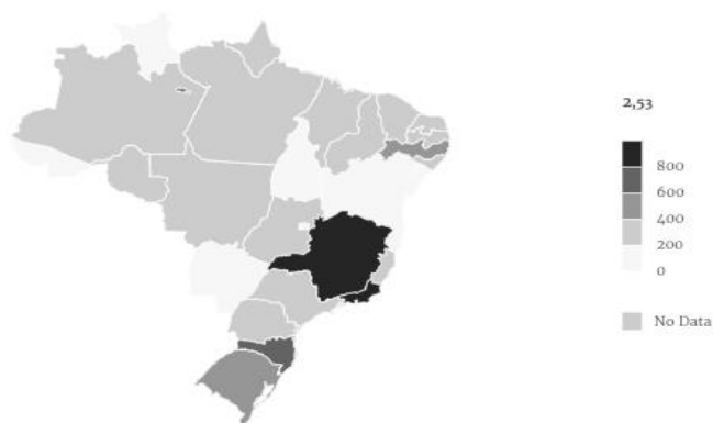
Figura 3: Distribuição das notificações de atendimentos por traumatismo dentoalveolar por estados do Brasil, durante o ano de 2021.