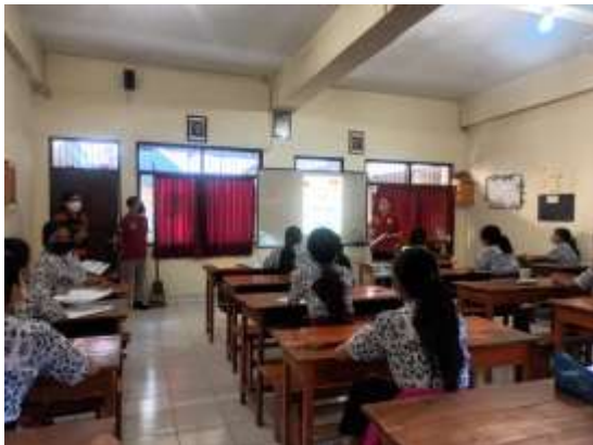
Gambar 2. Penyuluhan Kesehatan

Pemberian penyuluhan kesehatan dilaksanakan pada hari Kamis tanggal 21 April 2022 yang dihadiri oleh 36 orang siswa dengan tema Pentingnya Tablet Tambah Darah (TTD) untuk Mencegah Anemia. Selama memberikan penyuluhan siswa sangat antusias dilihat dari banyaknya yang pertanyaan serta beberapa siswa sudah rutin minum obat TTD. Setelah memberikan penyuluhan, tim juga melakukan pemeriksaan klinis siswa yang mengalami gejala anemia.