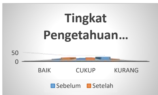
Gambar 6. Tingkat Pengetahuan

Berdasarkan gambar 6, tingkat pengetahuan sebelum diberikan penyuluhan mayoritas berada pada kategori kurang sebanyak 24 orang (67%) dan setelah diberikan penyuluhan sebagian besar pada kategori baik sebanyak 17 orang (47%).