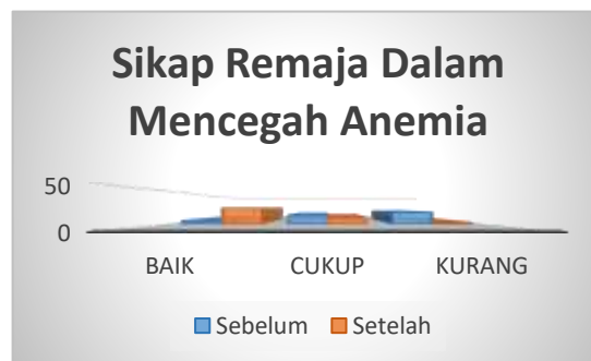
Gambar 7. Sikap Remaja Putri

Berdasarkan gambar 7, sikap remaja dalam pencegahan anemia sebelum diberikan penyuluhan mayoritas berada pada kategori kurang sebanyak 18 orang (50%) dan setelah diberikan penyuluhan sebagian besar pada kategori baik sebanyak 24 orang (67%).