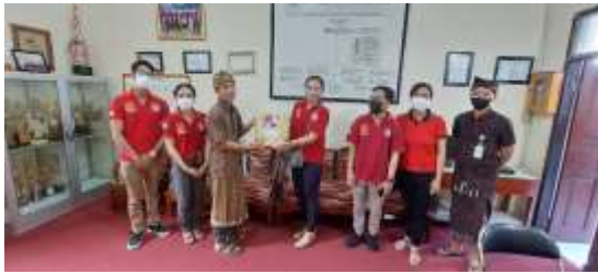
Gambar 1. Sosialisasi Kegiatan

pemeriksaan kadar hb bagi siswa yang mengalami gejala anemia.