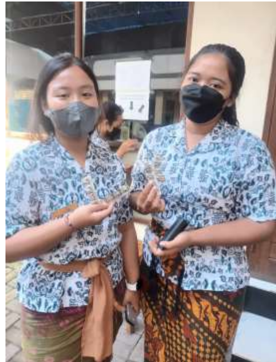
Gambar 3. Pemberian Tablet Tambah Darah

Tablet Tambah darah diberikan kepada siswa sebanyak 30 tablet per orang. Pemantauan konsumsi obat sementara dilakukan oleh guru wali kelas.