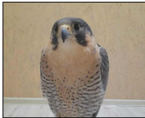
Сапсан ( Falco peregrinus ), изъятый у контрабандистов.

tion. During search operations officers found several self-made metal structures, containing 27 falcons, at the man's place of residence. The birds were confiscated by police investigators and handed over to animal protection workers 11 .