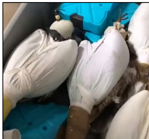
Соколы, изъятые у контрабандиста.

В аэропорту «Борисполь» 4 февраля 2022 г. сотрудники Госпогранслужбы, работники таможи, службы безопасности Украины и службы авиационной безопасности обнаружили четырёх соколов в багаже гражданина Украины, отправлявшегося в Доху (Катар). Птицы были завернуты в ткань и обмотаны клейкой лентой. Пограничники установили, что гражданин 1966 года рождения, на которого был зарегистрирован багаж, паспортный контроль не проходил и на посадку не явился. В отношении гражданина составлен протокол о правонарушении 4 .