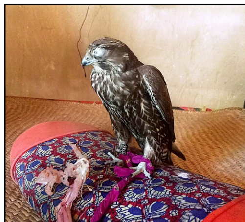
Балобан с кольцом D-745, отловленный в Пакистане.