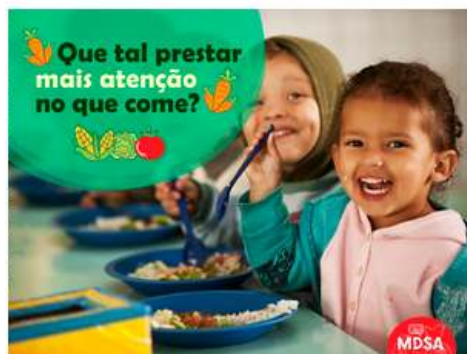
Figura 5 - Campanha alimentação saudável.