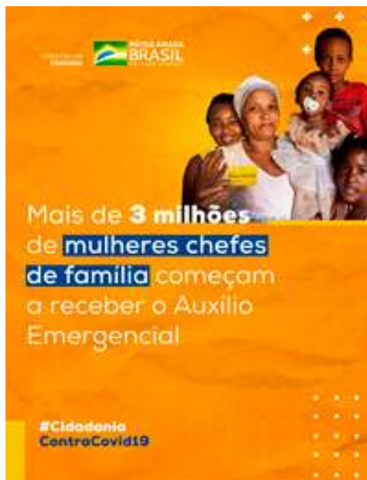
Figura 8 - Ênfase às mulheres como chefes de família e titulares do Programa.

no combate à pobreza. As mulheres “[...] se tornam, assim, sob diferentes justificativas, o alvo e o ator principal das políticas de transferência de renda [...] os programas de transferência de renda claramente se apoiam no capital de gênero para o cumprimento de seus objetivos”. Tal perspectiva ganha força imagética mesmo em campanha do PBF, a exemplo do cartaz reproduzido na Figura 8.