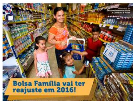
Figura 4 - Reajuste PBF e vinculação a alimentação.