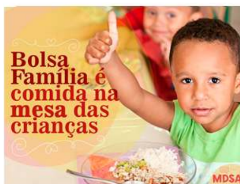
Figura 3 - Relação PBF, alimentação e criança.