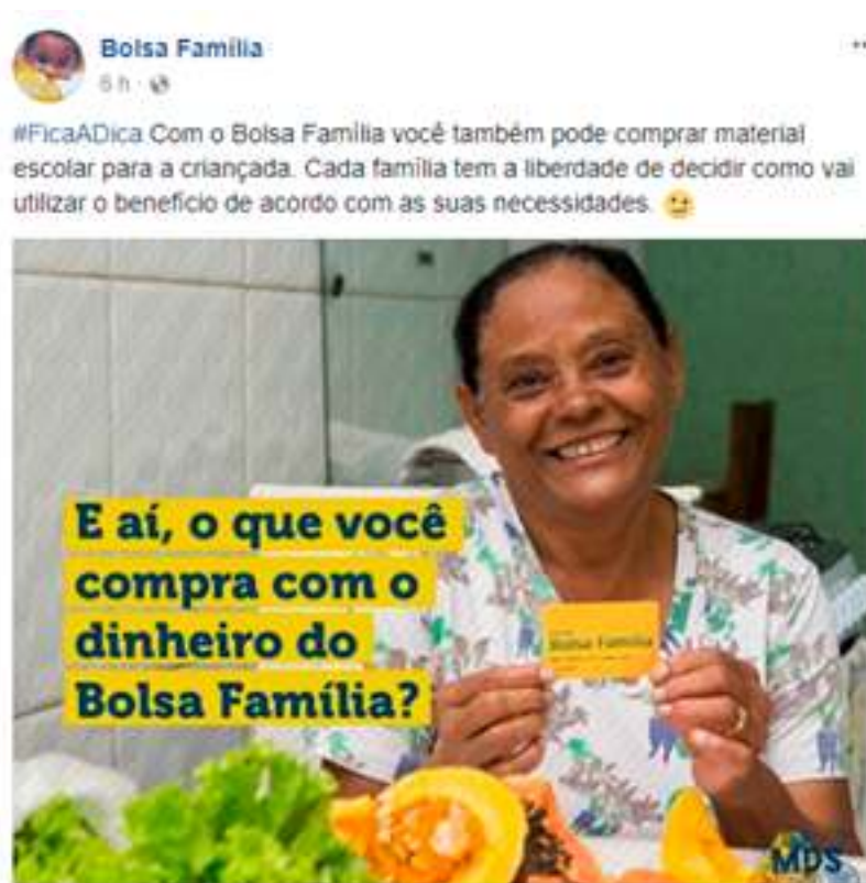
Figura 1 - Material de divulgação do Programa Bolsa Família.