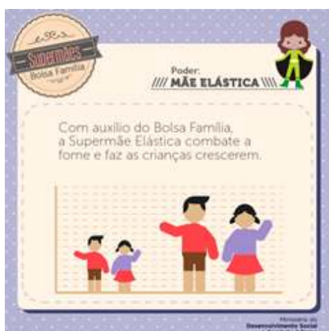
Figura 6 - Campanha Supermães do BF.