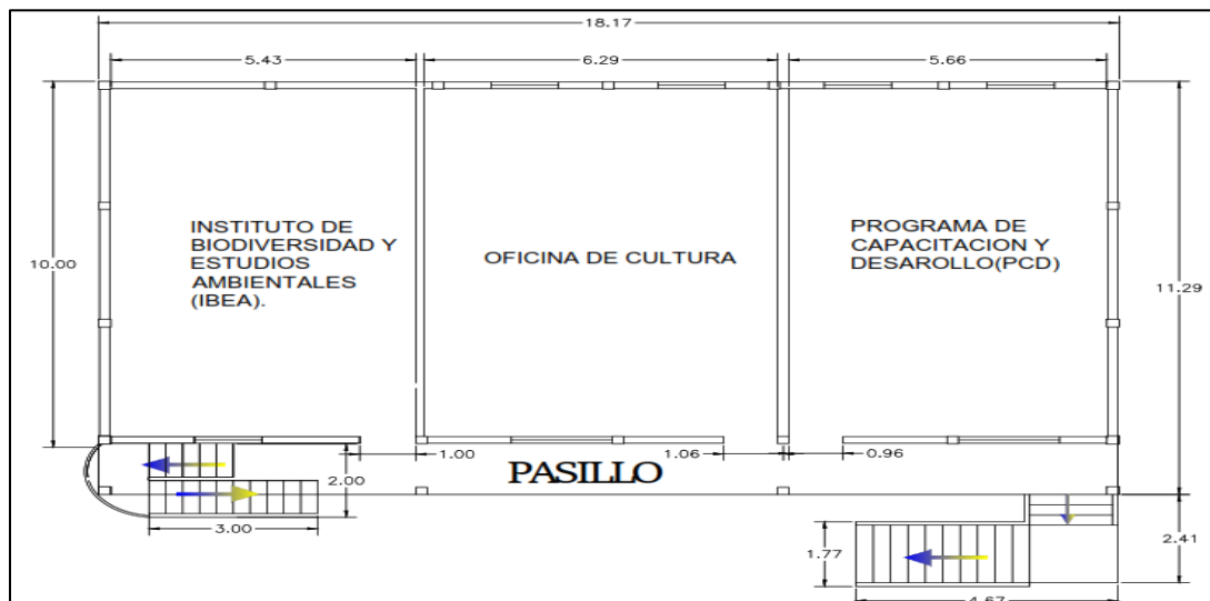
Figura 2. Plano de la planta alta del módulo 6

El módulo donde se ubica la biblioteca tiene un área aproximada de 1,033.26 m 2 , conformada por las oficinas de la biblioteca, la zona de estudio, Observatorio de Derecho Humanos y Autonómicos (ODHA) y servicios generales, dos auditorios (principal y sesiones) y un pasillo. El módulo 6 cuenta un área aproximada de 1,033.26 m 2 , conformada por un salón, un laboratorio, una bodega, fotocopiadora y dos baños. También se cuenta con tarima que se utiliza para asambleas, actividades culturales, entre otras cosas. También se tiene bodegas de artículos y materiales de construcción, cancha múltiple abierta donde se desarrollan deportes como baloncesto, voleibol, tenis de campo y futsala y dos estacionamientos vehiculares (uno para moto y otro para carros, camionetas y buses; ambos tienen capacidad para 20 vehículos).