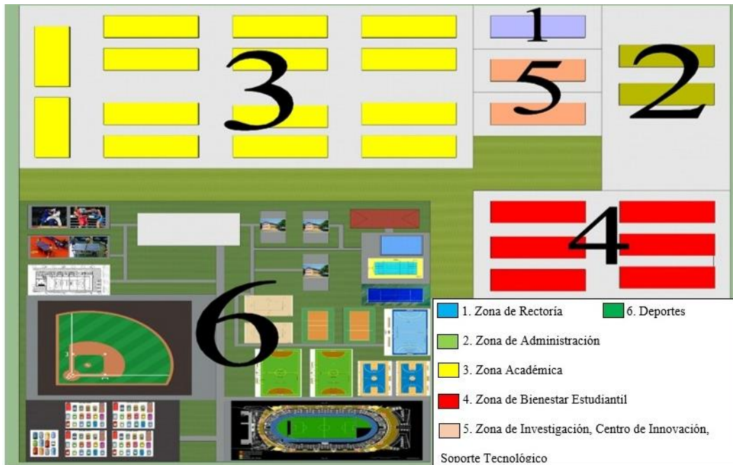
Figura 3. Zonificación propuesta para BICU-Bluefields

Según el análisis de los resultados, la universidad tendría que ocupar aproximadamente de 9.15 Ha (13.07 Manzanas) de terreno, para poder emplazar 6 zonas, exceptuando la zona de las fincas experimentales, las cual se propone que sean 35 Ha (50 Manzanas), ubicada en otro sitio. Se propone que la universidad se divida en 7 zonas siendo las siguientes: