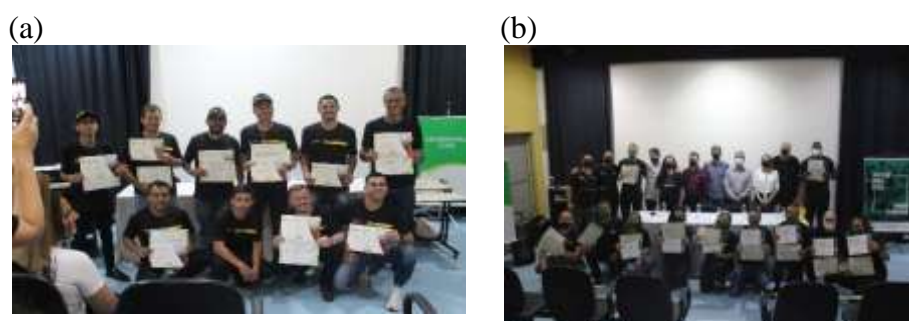
Figura 4- (a) Turma 2021. (b) Turma 2022

Os bolsistas tiveram a oportunidade de associar os conteúdos estudados no Curso de Engenharia Civil, exercendo a arte de ensinar e aprender com as vivências da sala de aula. As aulas oportunizaram o debate entre os alunos e instrutores valorizando as experiências práticas de forma fluida. Para os concluintes do Curso de Pintura foram realizadas uma solenidade de formatura no Bairro da Juventude, com a entrega de Certificados emitidos pela UNESC e Farben Tinta S.A., conforme Figura 4 (a) e (b).