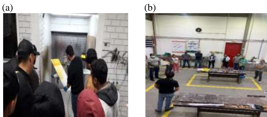
Figura 2- (a) Aula Prática no Iparque/UNESC. (b) Aula Prática no Farben Tintas S.A.

Cumprе salientar que, no ano de 2021 em plena pandemia, o projeto foi executado presencialmente observando os cuidados para garantir a integridade da saúde dos participantes, conforme Figura 2(a). Na edição do Curso no ano de 2022, flexibilizou-se o uso de máscaras e o contato entre professores, bolsistas e participantes do Curso, que conferiram momentos de trocas e saberes referente aos serviços de Pintura Imobiliária conforme a Figura 2(b). Nesta edição de 2022, também foram introduzidos os conteúdos teóricos e práticos de pintura moveleira e automotiva.