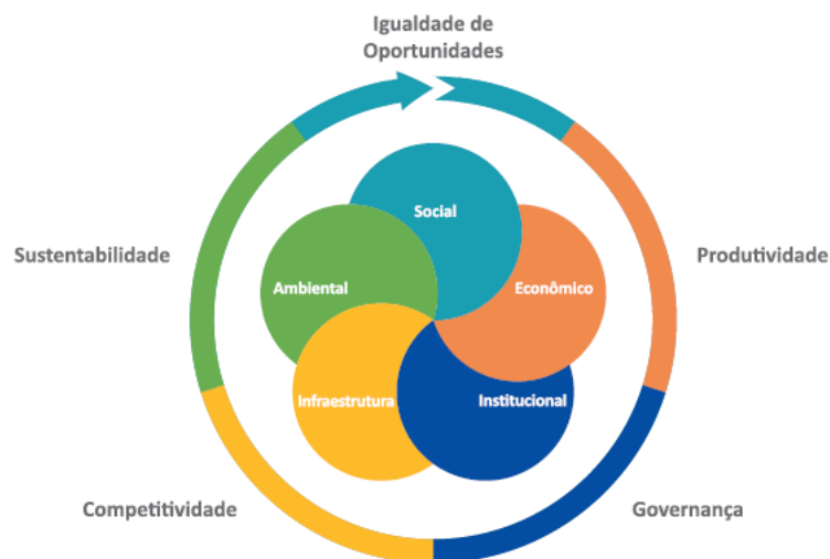
Figura 3- Eixos temáticos da ENDES 2019-2031

Fundada em cinco eixos fundamentais, a Estratégia Nacional de Desenvolvimento Econômico e Social, contempla essencialmente, a partir de seu caráter transversal e sinérgico, eixos imprescindíveis à sociedade, pois comunicam de forma clara e objetiva as prioridades do desenvolvimento econômico e social. Tal caráter, pode ser identificado na figura abaixo: