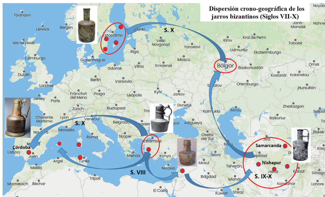
Fig. 8. Plano de dispersión crono-geográfica de los jarros bizantinos e islámicos en la Europa mediterránea durante los siglos II-V HG/VII-X d.C. y de su llegada a la Córdoba califal.

bizantinas, los encontramos arqueológicamente en las primitivas ciudades omeyas de la actual Jordania y en contextos cronológicos del ecuador del siglo VIII d.C. (fig. 8).