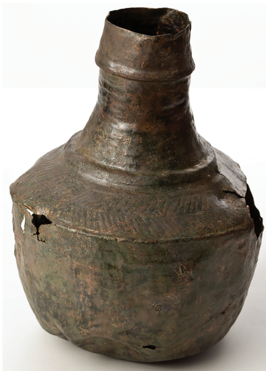
Fig. 4. Jarro bizantino de Santueri (Mallorca), nº inv. DA14/09/002.

A este excepcional conjunto hay que añadir dos ejemplares más hallados en la isla: uno en la población costera de Muro (VIVES, 1905-1907) y otro procedente de una colección privada y depositado en el Museu d’Història