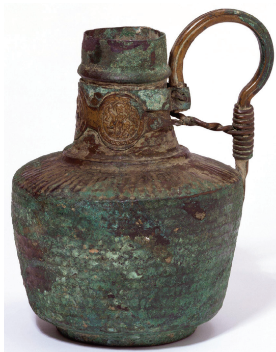
Fig. 3. Jarro de peregrino con vitola portando un motivo de jinete con lanza.