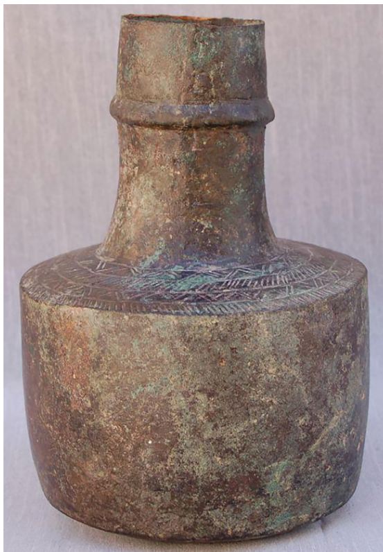
Fig. 5. Jarro hallado en el ḥammām del qaṣr omeya de Umm al-Walid, en la localidad jordana de Madaba.