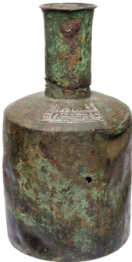
Fig. 7. Jarro con inscripción árabe, encontrado en el enterramiento ritual de una mujer, en Aska, Östergötland (Suecia).