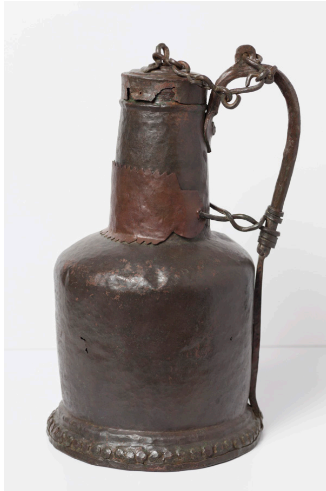
Fig. 1. Jarro/cántara que contenía el tesoro de dírham del Parque Cruz Conde de Córdoba.