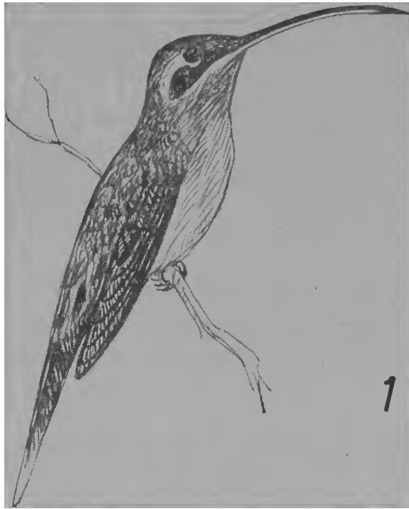
Fig. 1, Phaethornis maranhaoensis , sp. n., holótipo.

Canto: "zag zag tib zib übo üb, zag zag zib zib zag zag zib zib übo üb ..."; o "übo üb" não é regularmente emitido, sendo frequentemente eliminado do canto. O canto da espécie foi gravado.