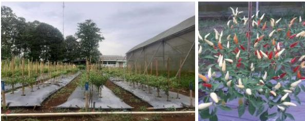
Gambar 1. Kondisi lahan tanaman cabai rawit Harita

Gulma yang paling banyak menyerang pada bedengan penelitian adalah teki ( Cyperus rotundus ). Pengendalian gulma dilakukan jika gulma sudah mulai menutupi lahan dan dilakukan secara manual pada antar bedeng dengan menggunakan kored atau dicabut hingga umbi teki terbuang. Pada bagian luar lahan penelitian gulma disemprot herbisida dengan bahan aktif parakuat diklorida. Kondisi lahan penelitian dan tanaman cabai rawit Harita siap panen dapat dilihat pada Gambar 1.