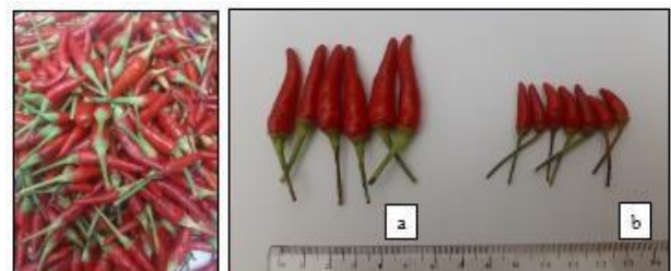
Gambar 3. Buah cabai rawit; buah layak pasar (a), buah tidak layak pasar (b)

sehingga akan berperan sebagai pelindung mekanis dari serangan hama dan penyakit (Djajadi 2013).