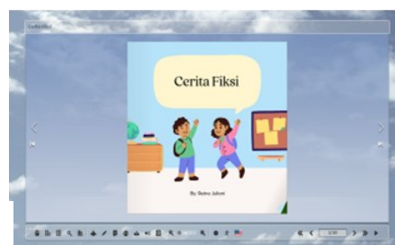
Gambar 2. Tampilan Halaman Kedua