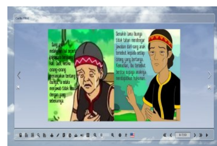
Gambar 3. Halaman Berikutnya Media Flipbook