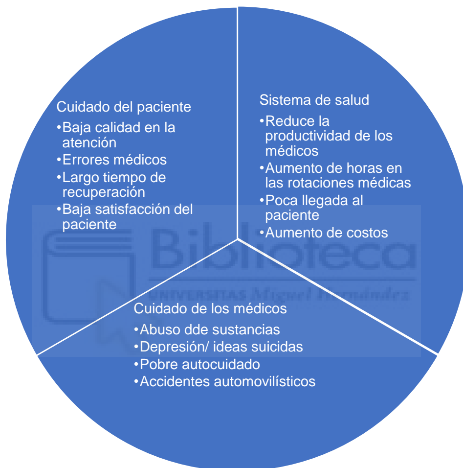
Figura 3. Consecuencias del Burnout en el personal sanitario

Un estudio del 2017, hizo énfasis en las consecuencias que tendría el burnout entre el personal sanitario, la atención al paciente y el sistema de salud. (Figura 3.)