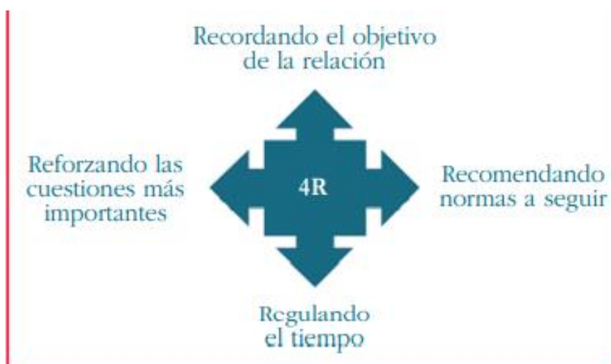
Figura 4. Regla de las 4R para distanciamiento social