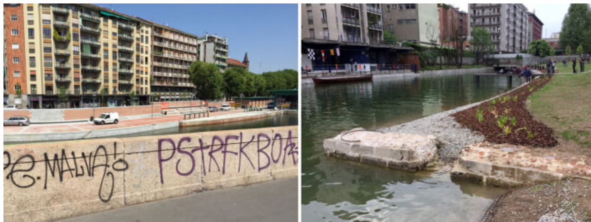
Il “falso sperone” dei bastioni spagnoli visto da viale Gorizia e frammenti di antiche mura in direzione di piazza Cantore.