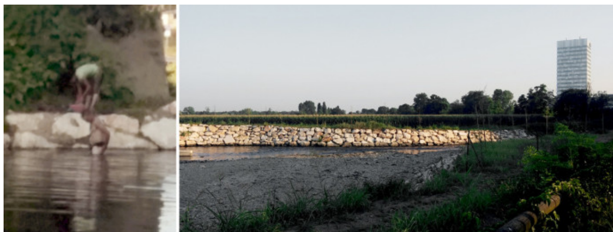
I bagnanti del Lambro nella torrida estate 2015.

Per l'Espresso, nel 1975 al Parco Lambro “finisce l'era del pop, comincia l'era del freak”: il fiume, per una volta, al centro.