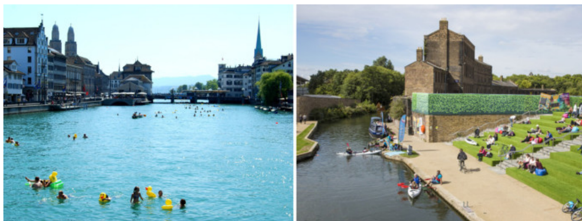
Bagnanti nel fiume Limmat a Zurigo e i nuovi spazi pubblici sul Regent's Canal di Londra.

This website uses cookies to improve your experience. We'll assume you're ok with this, but you can opt-out if you wish.