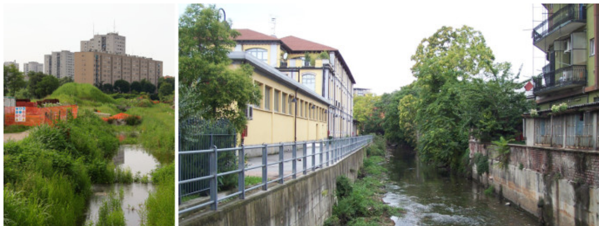
La roggia Vettabbia: il retro della città potrebbe trasformarsi in un nuovo fronte.

Già oggi molti spazi progettati, benché tutti fortemente sottoutilizzati, si allineano lungo il fiume – dal Parco Lambro al Parco Forlanini e all'area di Cascina Monluè, per citarne alcuni – mentre si moltiplicano gli episodi di appropriazione semi-spontanea delle sue sponde – come gli orti condivisi, ora formalizzati, lungo via Rizzoli, "all'ombra" degli RCS Headquarters di Boeri Studio (2001-2006).