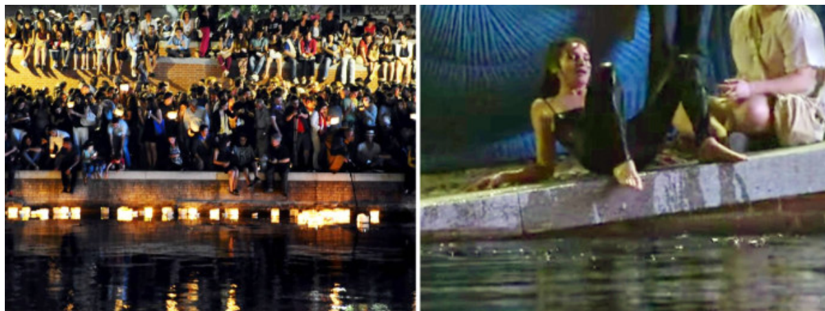
La Darsena di Milano sovraffollata durante la Notte delle Lanterne, il 24 giugno 2015.