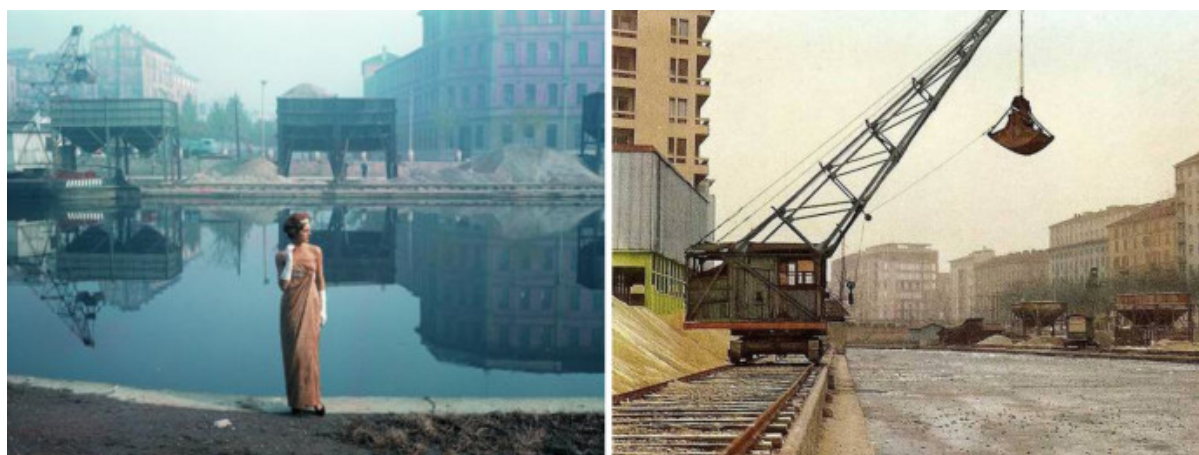
La Darsena com'era, in una foto di Ugo Mulas negli anni '50 e nell'inverno del 1985, con il bacino ghiacciato.

Al di là dei numeri astratti e degli aneddoti, e malgrado i limiti evidenti di un progetto architettonico non all'altezza della situazione, il successo della Darsena racconta di una Milano ansiosa di ripensare la propria dotazione di spazi pubblici e la gamma di prestazioni che essi offrono.