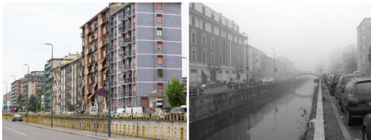
Il Naviglio Pavese oggi e le sue sponde usate come parcheggio, appena fuori dalla circonvallazione esterna.

Allo stesso modo, la Darsena riqualificata, svincolata dal passato ingombrante della città fortificata, potrebbe configurarsi come una delle teste centrali di un sistema ramificato di superfici continue, in grado di amplificarne la qualità e di trasportarla verso il territorio metropolitano, che ne è quasi completamente sprovvisto.