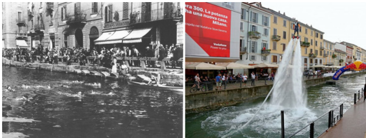
Una gara di nuoto sul Naviglio Grande negli anni '20 e un'esibizione di flyboard nel corso della manifestazione StraNavigli, 2015.