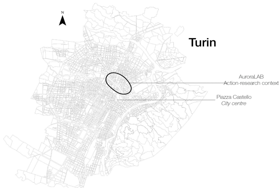
Figura 1 – AuroraLAB nel contesto territoriale del quartiere Aurora a Torino, elaborazione delle autrici

AuroraLAB nasce nel 2018 grazie a un piccolo finanziamento del Dipartimento Interateneo di Scienze, Progetto e Politiche del Territorio del Politecnico e Università di Torino per progetti di didattica innovativa e grazie all'attività di un gruppo aperto di docenti e giovani ricercatrici e ricercatori di varie discipline (urbanistica, geografia, sociologia, storia, economia, fisica tecnica, tecnologia) e agli studenti del Politecnico di Torino che collaborano con il laboratorio. AuroraLAB è attivo in un quartiere complesso dell'area nord del centro storico della città di Torino, il quartiere Aurora, caratterizzato da molteplici fragilità di tipo socioeconomico unite tuttavia ad un tessuto associazionistico estremamente attivo e presente, oltre a grandi trasformazioni spaziali in corso.