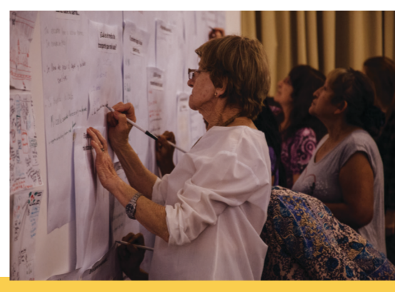
Varias imágenes de talleres con mujeres de Alberdi, Villa Páez y Marechal para cartografiar sus rutas diarias y servicios de cuidado.