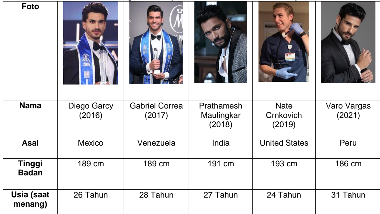
Tabel 2. Biodata Para Pemenang Mister Supranational dari tahun 2016 sampai 2021

Hasil dari pengumpulan data yang dilakukan, indikator dari “Tampan” yang mendominasi adalah indikator brewok. Pada Tabel 2, peneliti memberikan informasi tambahan terkait biodata para pemenang Mister Supranational dari tahun 2016 sampai 2021.