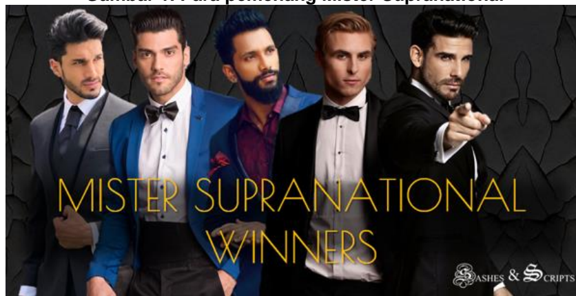
Gambar 1. Para pemenang Mister Supranational

Penelitian ini menggunakan metode analisis isi, yang merupakan alat untuk menyelidiki dan menganalisis komunikasi dalam arti pesan yang metodis, tidak memihak, dan kuantitatif (Wimmer & Dominick, 2013). Analisis isi juga digunakan untuk menilai isi pesan dan memproses isi pesan, atau alat untuk menganalisis tindakan komunikasi terbuka melalui komunikator yang dipilih (Budd et al., 1967). Penggunaan analisis memiliki berbagai fungsi dan keuntungan, termasuk (a) menggambarkan dan mengkontraskan materi media; (b) konten media dan realitas sosial yang kontras; Mengetahui tujuan dan pengaruh media; menilai kinerja media; dan (c) materi media mencerminkan nilai-nilai dan sistem kepercayaan sosial, budaya, dan agama masyarakat (McQuail, 2010).