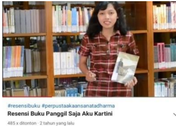
Gambar 10. Panggil Saja Aku Kartini

contohnya yaitu pada resensi berjudul “Panggil Saja Aku Kartini” yang menampilkan peresensi menyampaikan resensi di ruangan perpustakaan.