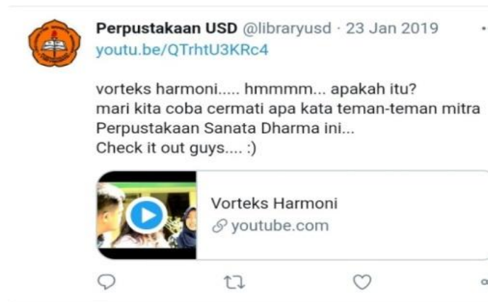
Gambar 13. share link ke twitter

Dari pengamatan yang dilakukan peneliti dalam segi promosi atau publikasi resensi audio visual, dikatakan tim movie maker masih mengalami kesulitan. Dikarenakan di sini pihak perpustakaan sudah melakukan promosi link video resensi melalui beberapa media sosial milik perpustakaan seperti facebook dan instagram , akan tetapi viewer video yang di upload ke kanal youtube perpustakaan masih sedikit. Pihak perpustakaan sampai saat ini belum melakukan evaluasi terhadap adanya resensi audiovisual ini, dikarenakan masih banyak projek lain di perpustakaan yang akan dikerjakan.