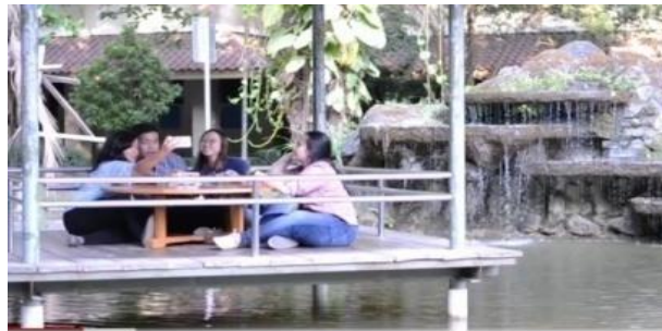
#resensibuku #perpustakaanсанатаधर्मा Resensi Buku Audio Visual "Mendidik Generasi net"

Pengambilan gambar dilakukan di luar ruangan, seperti di taman fakultas, atau lingkungan di sekitar kampus dan perpustakaan USD. Contohnya pada resensi buku berjudul “Mendidik Generasi Net” lokasi memperlihatkan mahasiswa yang sedang duduk disebuah gazebo dilingkungan kampus Paingan.