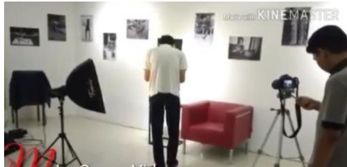
Gambar 1. Mitra Perpustakaan Take video

Kegiatan ini merupakan sebuah ide yang digagas oleh salah satu staf pengembangan Perpustakaan Universitas Sanata Dharma. Resensi buku secara audiovisual adalah hal baru yang dibuat oleh perpustakaan sebagai salah satu langkah pengembangan perpustakaan, dengan harapan untuk mengubah pengertian kuno tentang perpustakaan merupakan sebuah ruangan yang dipenuhi dengan buku, majalah, artikel, dan koleksi tercetak lainnya. Akan tetapi kita dapat menjadikan perpustakaan yang hommy bagi pemustaka dan dapat memberikan fasilitas kepada pemustaka untuk berkarya seperti resensi audiovisual ini. Serta seiring berjalannya zaman yang semakin lama selalu up to date atau dengan kata lain telah mengalami perkembangan dalam hal digital yang cukup pesat. Maka dari uraian ini dapat tarik nilai pentingnya yaitu Perpustakaan sebaiknya terus mengikuti perkembangan zaman dan perkembangan digital supaya terus up to date dan tidak tertinggal zaman.