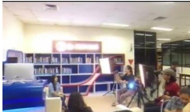
Gambar 11. Proses Produksi Resensi

perpustakaan sudah siap dengan tugasnya masing-masing. Sutradara akan mengatur dan mengarahkan kameramen dan presenter memastikan bahwa pengambilan gambar sesuai dengan perencanaan awal. Seperti yang dikatakan oleh mitra perpustakaan bahwa untuk produksi video biasanya mereka sudah membuat catatan tertulis mengenai susunan proses yang akan dikerjakan demi memudahkan tim dalam mengetahui take yang mana saja yang sudah dan belum dikerjakan.