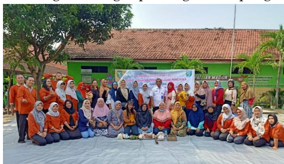
Gambar 1. Pembukaan dan sambutan

Tahap pertama yang dilakukan adalah melakukan pembukaan acara. Pada kegiatan ini disampaikan perkenalan, maksud, tujuan, kegiatan dan luaran yang akan dihasilkan. Acara ini juga disambut oleh kepala SDN 03 Taman Kota Madiun. Adanya dukungan dan motivasi kelembagaan sangat penting untuk penguatan P5.