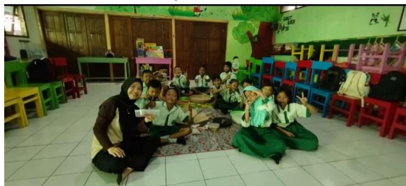
Gambar 2. Penyampaian materi P5

kesehatan mental, budaya, wirausaha, teknologi, dan kehidupan berdemokrasi sehingga peserta didik dapat melakukan aksi nyata dalam menjawab isu-isu tersebut sesuai dengan tahapan belajar dan kebutuhannya.