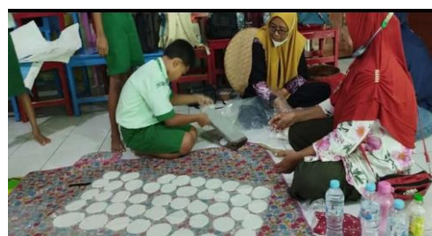
Gambar 4. Proses pembuatan krupuk puli