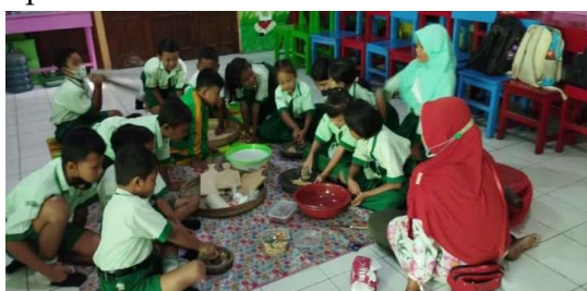
Gambar 3. Proses pembuatan sambal pecel

Dalam program ini, P5 yang dirancang adalah pembuatan sambel pecel dan krupuk puli khas Kota Madiun.