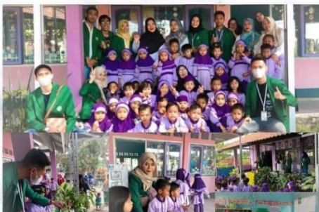
Apoteker Cilik dan pembagian vitamin gratis di TK PKK Desa Teros [ Program kerja dari prodi Farmasi ] Rabu, 31 Agustus 2022 @kkndesateros.klmpk52_