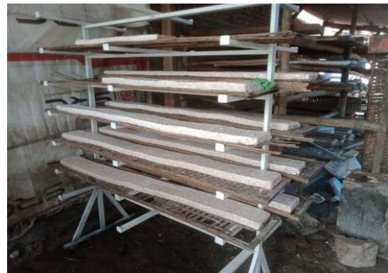
Gambar 4. Rak jadi tempe