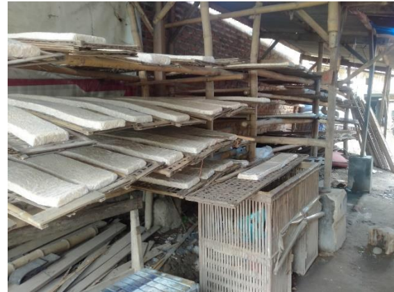
Gambar 1. Gambar Rak Tempe Mitra

Berdasarkan wawancara dan diskusi mitra terdapat kegiatan yang ditiadakan yaitu Perbaikan tempat pencucian, karena harus menghentikan produksi yang saat ini dalam kondisi ramai.