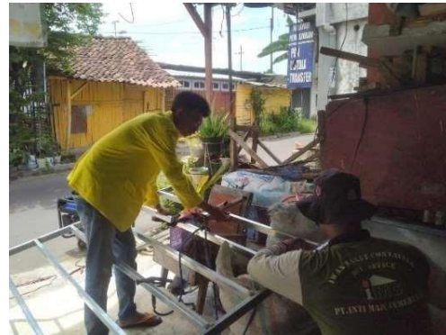
Gambar 3. Proses pembuatan rak tempe