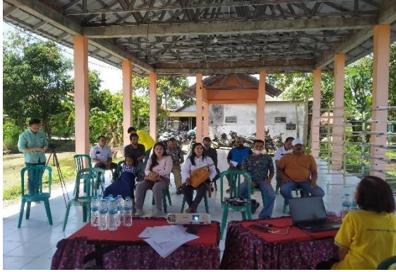
Gambar 5. Pelatihan Penyusunan SOP

Dalam penjelasannya Apa, Kapan, Siapa dan Bagaimana menyusun SOP disampaikan dengan bahasa sederhana sehingga mudah dimengerti oleh peserta pelatihan. Juga diberikan contoh dalam menyusun SOP pembuatan tempe menggunakan Gambar, Hirarki dan juga flowchart. (Lestari et al., 2022) Hasil dari pelatihan ini peserta dapat menyusun sebuah SOP Pembuatan Tempe mengacu pada dokumen (International Organization for Standardization [ISO], 2001).