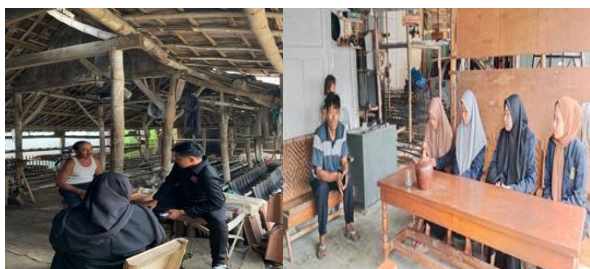
Gambar 2. Wawancara dengan pengrajin genteng