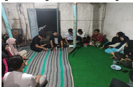
Gambar 3. Diskusi perencanaan Digital Marketing

Tim pengabdian dari STKIP PGRI Jombang memberikan sosialisasi kepada pengrajin genteng Desa Karanglo mengenai digital marketing. Sosialisasi ini diberikan sebagai upaya pengembangan teknik pemasaran genteng secara digital di Desa Karanglo.