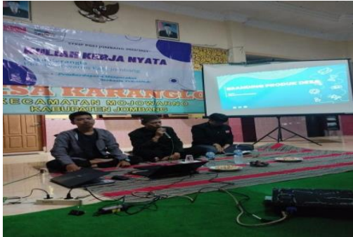
Gambar 5. Pelaksanaan sosialisasi dan pelatihan pengelolaan shopee

Hasil dari sosialisasi digital marketing ini berupa akun shopee yaitu http://shopee.co.id/kkn15desakaranglo