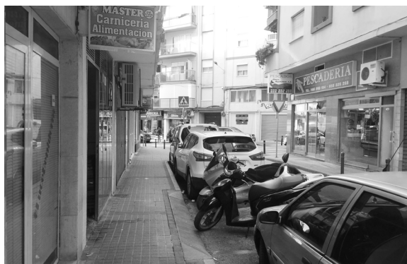
Fig. 37. C/ de Júpiter (Benidorm)