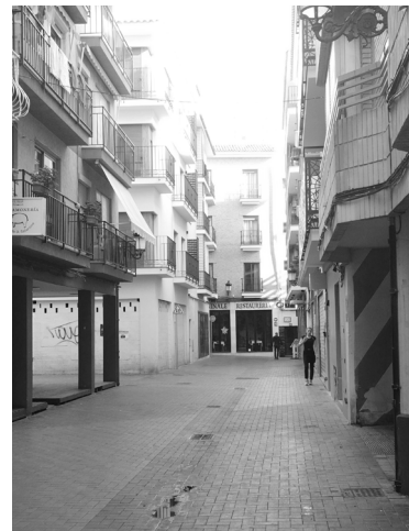
Fig. 32. C/ del Moli (Benidorm)