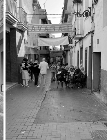
Fig. 6. C/ de la Palma (Benidorm)