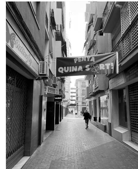
Fig. 3. C/ de la Parra (Benidorm)