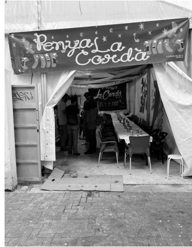
Fig. 4. C/ de la Biga (Benidorm)