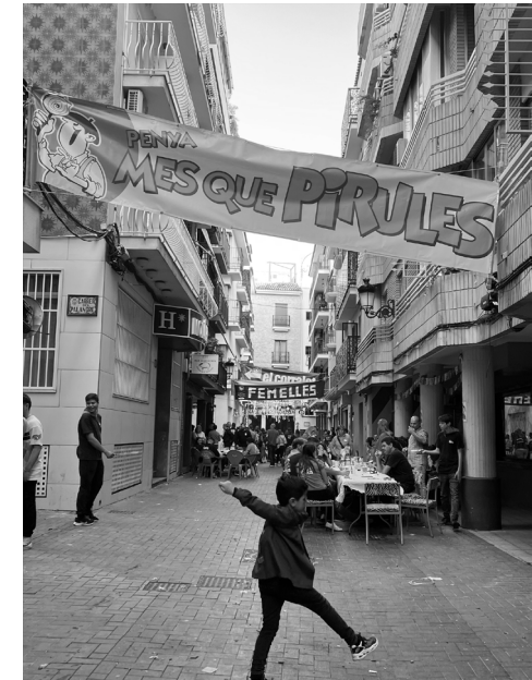
Fig. 2. C/ del Moll (Benidorm)

Per altra banda, és interessant veure com l'espai canvia durant el transcurs del dia, contràriament com podria passar a un habitatge normal mediterrani, el mobiliari no és fix i les estances no estan definides. Bé és cert que els diferents espais d'un carrer o d'un local tenen certes característiques que afavoreixen l'aparició de certes activitats concretes, però aquestes activitats poden canviar de localització o poden aparèixer i desaparèixer puntualment. Per exemple, abans de dinar, si el local no compta amb una cuina, s'ocupen les entrades, porxos o espais a l'aire lliure amb poc corrent d'aire per encendre un foc, però a l'hora a cel obert per evacuar els fums, i es cuina al mateix carrer, mentre que alhora es produeix al muntatge de mobiliari per parar taula a un lloc una mica més apartat i protegit, ja que l'acte de dinar està més orientat als usuaris de la mateixa penya. Així i tot, es pot estar produint una altra activitat al mateix temps, alguns dels penyistes han convidat a amics o familiars a compartir mitjançant la "picaeta" com a acte social, menjar i bones converses.