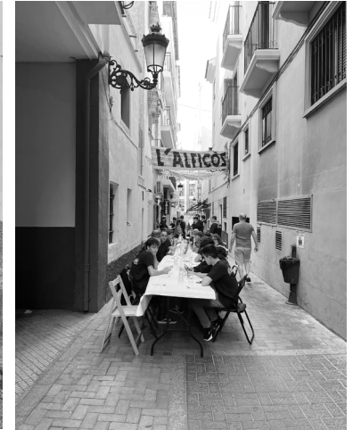
Fig. 7. C/ Santíssima Trinitat (Benidorm)