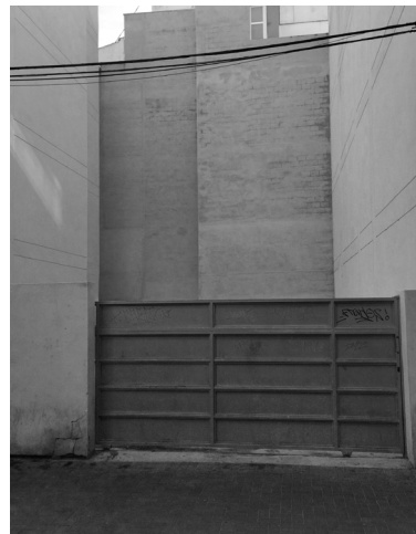
Fig. 31. C/ de la Biga (Benidorm)