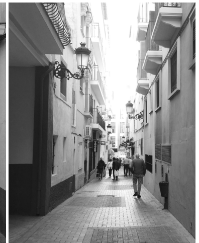
Fig. 34. C/ Santíssima Trinitat (Benidorm)