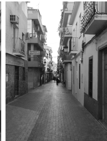
Fig. 33. C/ de la Palma (Benidorm)