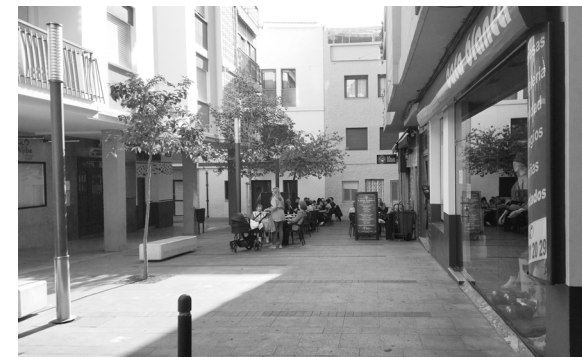
Fig. 36. C/ de la Parra (Benidorm)