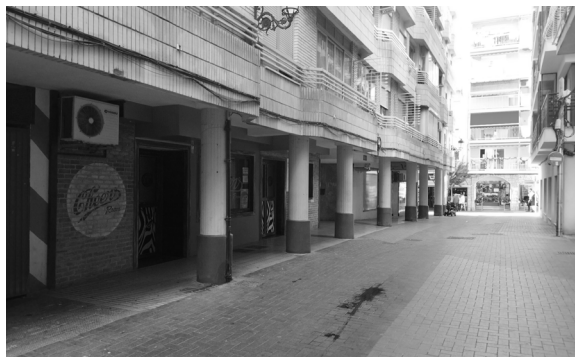
Fig. 35. C/ de la Biga (Benidorm)

El segon caràcter "Y" de la denominació ".XY", pretén explicar el tipus d'ocupació que es produeix en els diferents espais col·lectius que es mostren al treball.