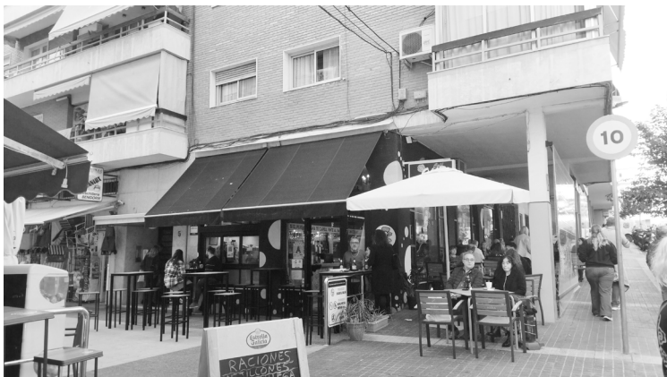
Fig. 35. Passatge de Santa Rita (Benidorm)

Per començar l'anàlisi dels espais col·lectius, en primer lloc, es busca un mètode per mostrar i explicar els tipus i les formes d'ocupació que es produeixen durant el període de festes de Benidorm. D'aquesta manera es decideix crear una classificació dels espais per detallar més fàcil i ràpidament com és el tipus d'espai que s'ocupa. Aquesta classificació pot ser estesa en una futura expansió del treball per incorporar nous espais i noves activitats per enriquir l'anàlisi.