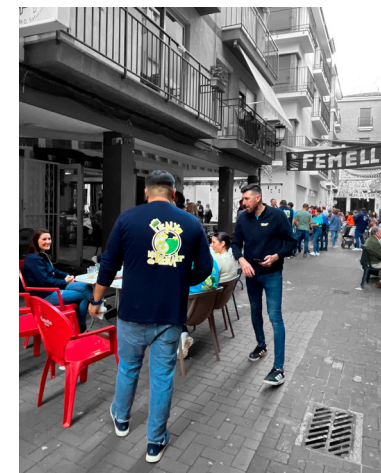
Fig. 8. C/ del Moli (Benidorm)