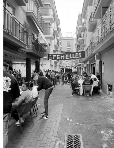
Fig. 5. C/ del Moli (Benidorm)