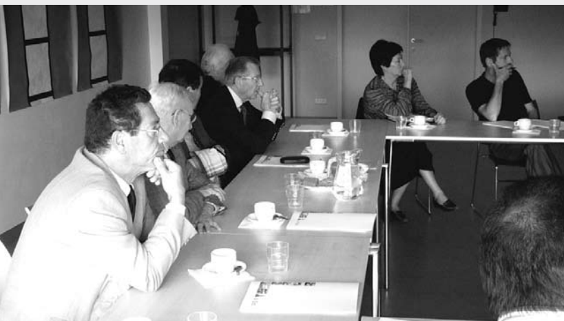
Bezoek probatiecommissie Kortrijk.