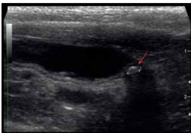
Figuur 1. Dilatatie van de distale ureter met een ureteroliet ter hoogte van de ureterovesicale overgang (pijl).

structie waargenomen, veroorzaakt door een uroliet ter hoogte van de ureterovesicale overgang met een secundaire mega-ureter (4,3 cm diameter) (Figuur 1), erge linkernierbekkendilatatie (2 op 2,3 cm) en de aanwezigheid van een kleine hoeveelheid vocht in het retroperitoneum. De corticomedullaire overgang was slecht afgelijnd en enkel een smalle band corticaal weefsel resteerde rond de nierbekkendilatatie. De rechternier vertoonde tekenen van chronische nierziekte (lengte 2,7 cm, onregelmatig afgelijnd) en verschillende kleine en niet-obstruerende urolieten in de proximale ureter. Er werden multipiele urolieten in beide nieren, de ureters en de blaas aangetoond. Voor