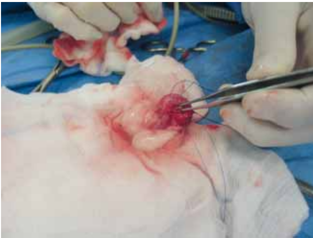
Figuur 3. Intraoperatieve opname van het verwijderen van de cystoliet (pincet) uit de blaas.

gedilateerd. Ter hoogte van de ureterovesicale junctie waren drie stenen te zien waarvan er één deels in het lumen leek uit te puilen.