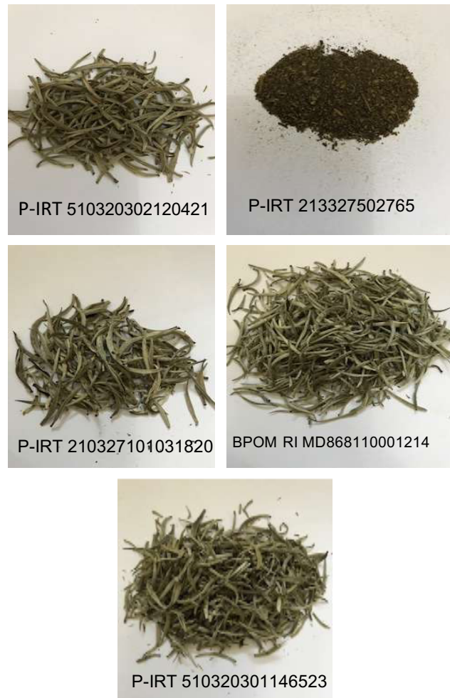
Gambar 1. Foto hasil uji organoleptik teh putih

Sampel teh putih dapat dilihat seperti Gambar 1. Secara umum teh putih berbentuk partikel tergulung padat terpilin, berwarna putih, berbau khas teh, dan memiliki rasa seduhan yang sepat.