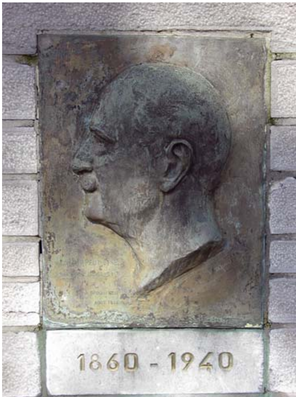
Fig. 5. Inès De Broqueville, Gedenkplaat Graaf Charles de Broqueville , ca. 1940, Sint-Lambrechts-Woluwe, Square Josephine Charlotte.