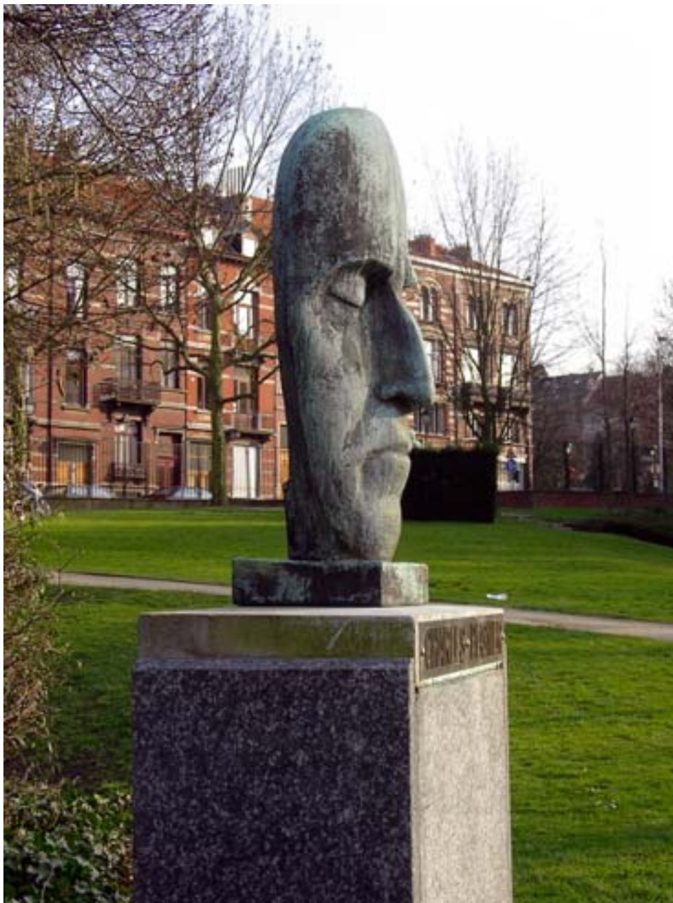
Fig. 2. Akarova, Standbeeld Charles Plisnier (masker) , ca. 1946 (?), Sint-Gillis, Baron Pierre Pauluspark. Foto: Marjan Sterckx, 2005