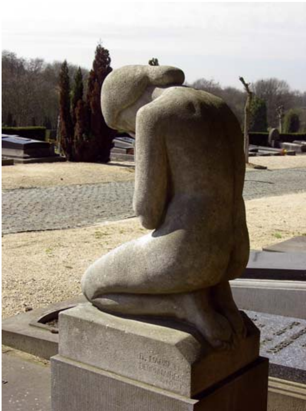
Fig. 10. Marin, Treurende vrouw , 1951, Ukkel, begraafplaats Verrewinkel. Foto: Marjan Sterckx, 2005