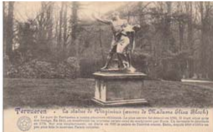
Fig. 1a. Elisa Bloch, Virginie , brons, 1886, Tervuren, Park van Tervuren. Oude postkaart, ca. 1912: E. Desaix éditeur, Brussel.

toen mee aan grote sculptuurenssembles, zoals in de Kruidtuin en de Kleine Zavel, maar bij deze projecten, die de stad tot ‘openluchtmuseum’ moesten maken, betrok men voor zover geweten geen vrouwelijke beeldhouwers.