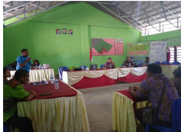
Gambar 3. Penyampaian Materi

Program PKM ini bertujuan untuk membantu mitra Badan Usaha Milik Desa (BUMDesa) Desa Tunbaun mengatasi tantangan yang mereka hadapi. Implementasi program PKM bagi mitra, pelaporan keuangan BUMDes dengan pendekatan edukasi. Sesi terakhir dari kegiatan PKM adalah proses pendampingan praktik pelaporan keuangan BUMDes. Proses ini dirancang untuk memastikan bahwa peserta memiliki perencanaan, kontrol, dan akuntabilitas keuangan yang tepat. Setelah melakukan beberapa putaran pelatihan dan membuktikan bahwa mitra kompeten, tim PKM menyiapkan tiga laporan keuangan: laporan laba rugi, neraca dan arus kas, yang merupakan prinsip akuntansi perusahaan jasa.