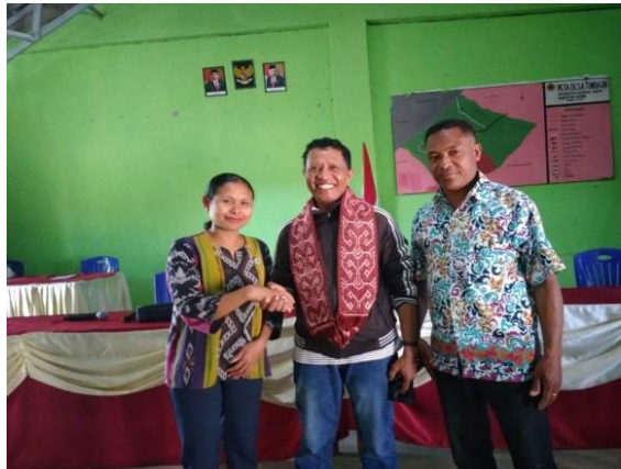
Gambar 2. Pengalungan Ketua Panitia

kepada peserta pelatihan guna mengubah paradigma untuk memperlancar pelaksanaan program PKM.