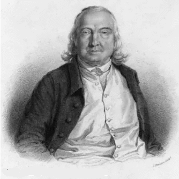
Figuur 0.3 Jeremy Bentham>