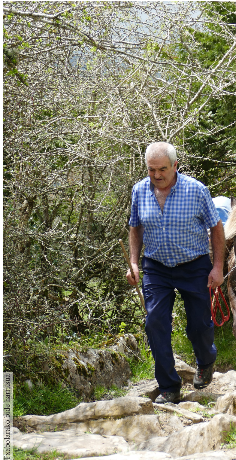
Txabolarako bide harritsua

Ardiak ere gustura igo dira. Baten bat herren zegoen eta zailtasunak izan ditu, baina, gainerakoan, artzainaren seme-alabek ez dute lan handirik izan artaldearen atzealdean. “Hauek [ardiak] bakarrik ere igoko lirateke”, azaldu du Nazabalek. Tarteka amorrarazi ere egin dute, etengabe artzaina zein zaldia