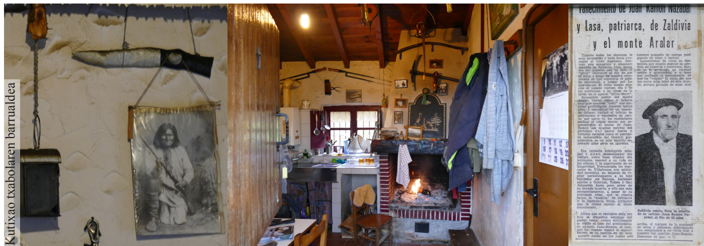
Kutixao txabolaren barrualdea

Egunean bi aldiz jetzen ditu ardiak: “Ardiak jetzi, esnari gatzagia bota eta gazta egin”. Goizez eta arratsaldez. Hori Aralarren dagoenean. Neguan, Oiartzunen, ez du gatzarik egiten, baina “antzeko