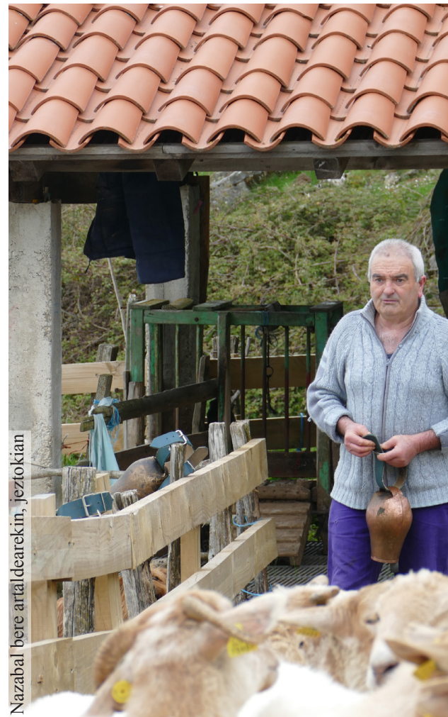
Nazabal bere artaldearekin, jeztozorian

1992an heldu zen argindarra Kutixao txabolara eta, egun, ur korronea zein ur berogailua ere baditu bertan: “Gaur egun, normala da, baina jarri zute-