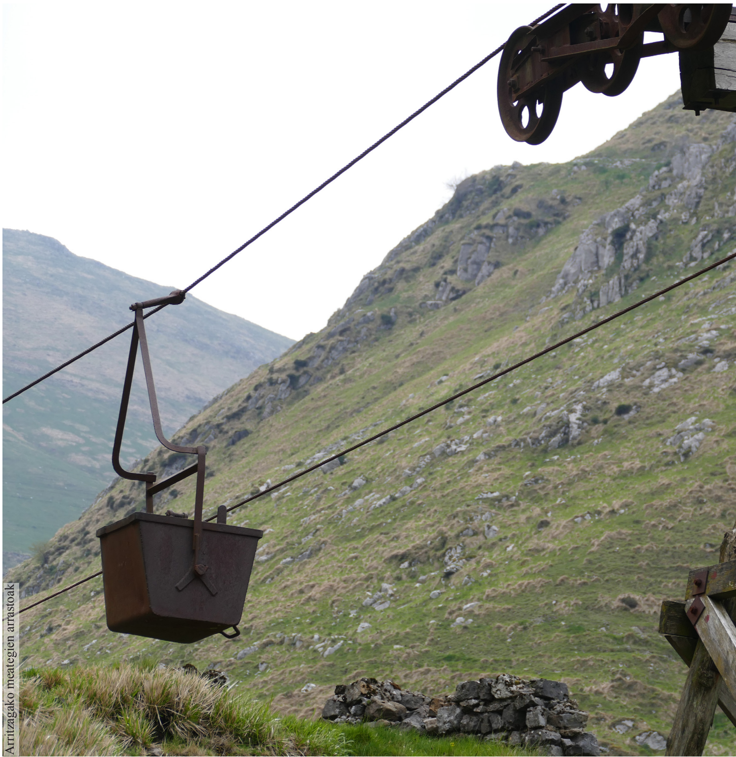
Arritzagako meategien arrastoak