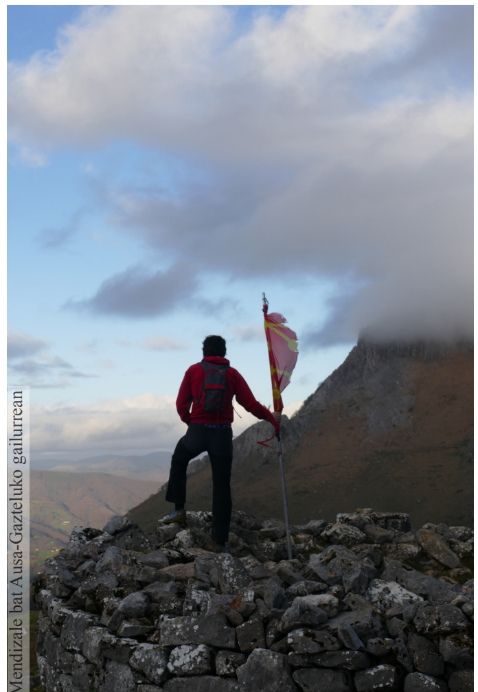
Mendizaile bat Ausa-Gazteluko gailurrean

Irakaskuntza eta hezkuntza garatu ahal izateko, ordea, ezagutza sortu behar da lehenik. Ikerketa zientifikoak funtzio hori dauka eta, horretarako ere, leku aproposa da Aralar; zenbait alorretako adituak elkartu izan dira bertan eta ikerketa ugari gauzatu dituzte.