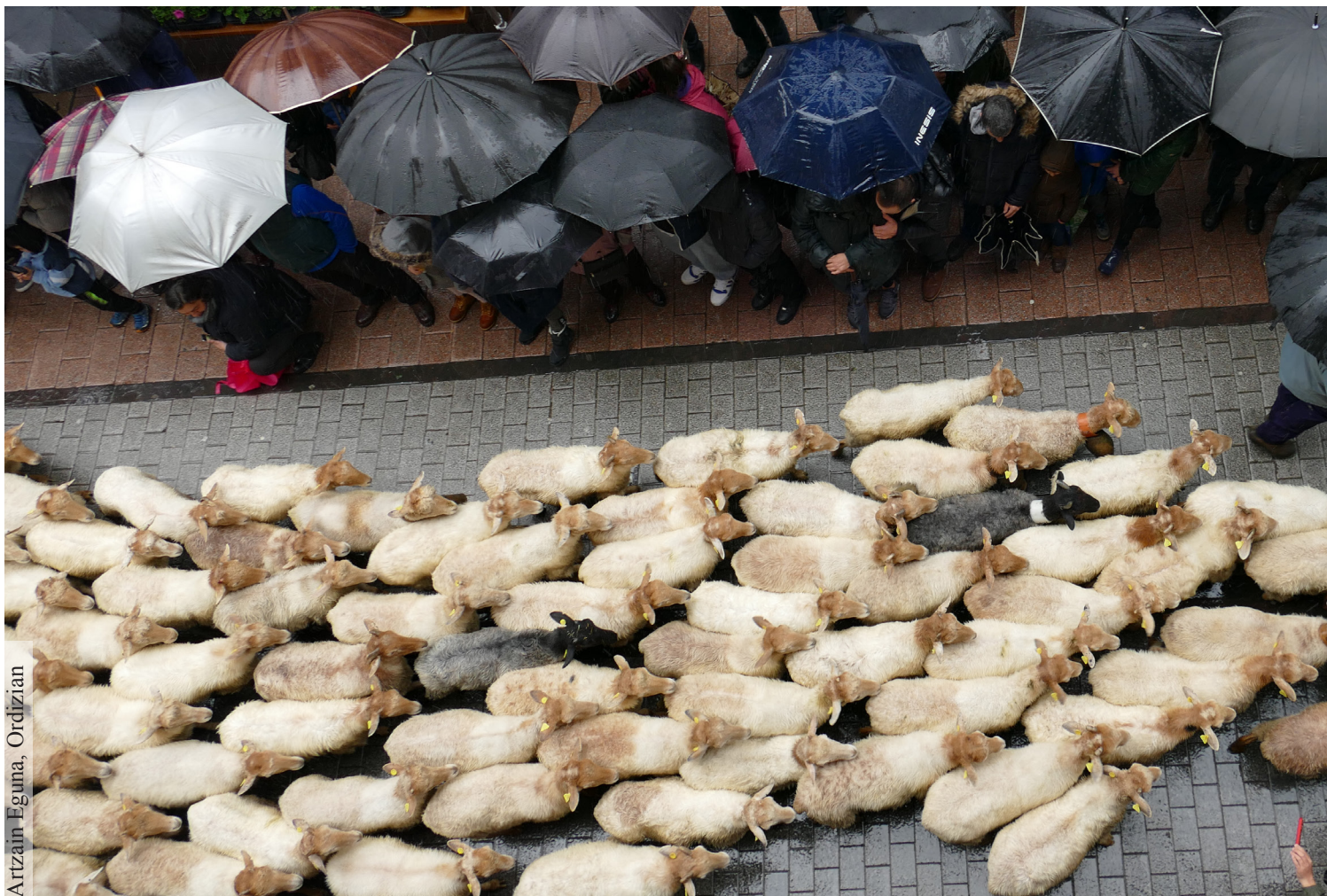
Artzain Eguna, Ordizian

Artzaintza ez da lan erraza eta atsedenerako tartarik ere apenas du, baina amezketarrak maite du bere ogibidea: “Askotan pentsatu dut dendako lana utzi eta, erabat, artzaintzatik bizitzea”. Halere, momentu honetan egoera ez da erraza: “Zalantzan negoen artzaintzak bizitzeko adina ematen zuen ala ez, baina hemendik aurrera, ezetz esango nuke”.