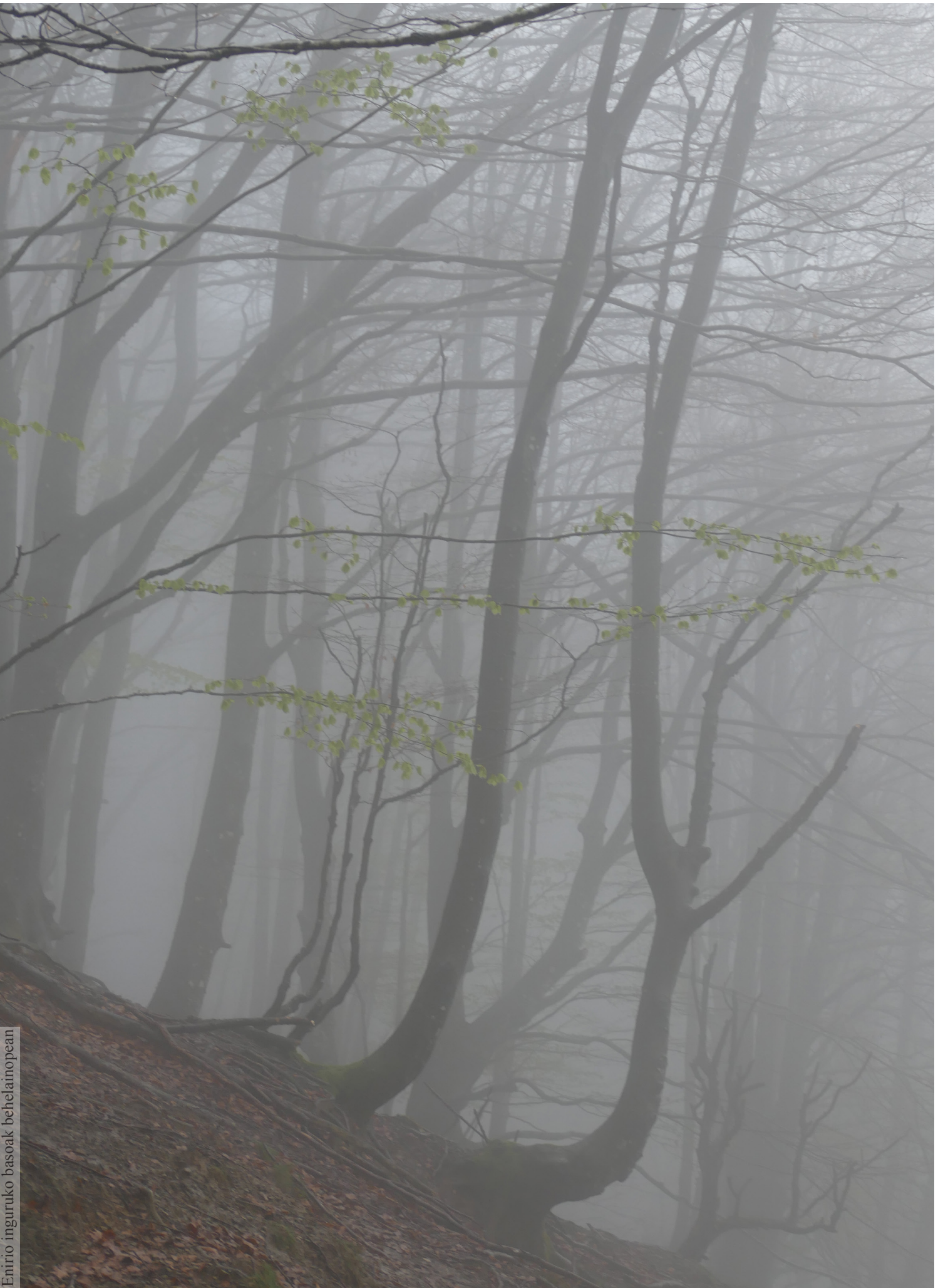
Emirio inguruko basoak behelatupean