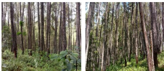
Gambar 1. Tegakan Pohon Pinus di HKm Sipatuo

Tegakan pohon pinus di HKm Sipatuo memiliki kerapatan yang berbeda, di lokasi tertentu yang jarang atau kerapatannya rendah sudah ada tanaman lain yang ditanam oleh penyadap berupa tanaman kopi robusta ada yang menghasilkan buah dan ada juga yang belum berbuah. Kondisi tegakan pohon pinus di HKm Sipatuo ditunjukkan pada Gambar 1.