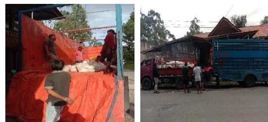
Gambar 5. Pengiriman getah pinus ke CV.Pindo Indonesia di Makassar

Berdasarkan Gambar 4, saluran pemasaran getah pinus di HKm Sipatuo, petani yang sudah memanen getah pinus akan menjual getah di mitra. Penimbangan getah pinus dilakukan di mitra, getah yang dijual dikemas di dalam karung yang dilapisi plastik agar getah aman, getah yang dijual masih dalam bentuk mentah. Mitra merupakan pengumpul atau pedagang perantara satu, selanjutnya mitra akan menjual getah pinus ke pengumpul besar yaitu CV.Pindo Indonesia di Makassar, dimana getah pinus yang dijual masih dalam bentuk mentah.