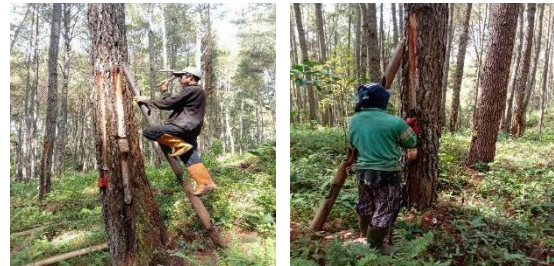
Gambar 2. Pembaruan Luka pada Pohon Pinus (Metode Koakan)

Penyadapan getah pinus di Lembang Pa'tengko menggunakan metode Quarre (koakan). Metode Quare (koakan) yang digunakan yaitu dengan proses pelukaan pada permukaan kayu dengan pengirisan berupa huruf U terbalik dengan kedalaman 1,5 cm, kemudian tempat penadah yang terbuat dari tempurung kelapa dan juga botol air mineral 1500 ML yang diletakan di bagian bawah pohon pinus yang sudah di lukai, pembaharuan koakan rata-rata setiap 2 minggu sekali, dengan panjang 2 cm.