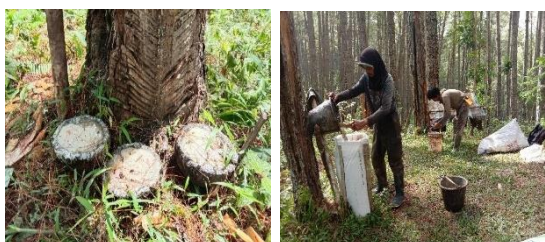
Gambar 3. Proses Pemanenan Getah Pinus

Tabel 5 menunjukkan jumlah produksi getah pinus 500 kg – 700 kg merupakan jumlah responden paling banyak yaitu 14 orang dengan persentase 35%, banyaknya pohon yang di sadap oleh penyadap tidak terlalu berpengaruh pada banyaknya produksi getah pinus yang didapatkan karena dalam penelitian ini ada beberapa tanaman pohon pinus yang kurang menghasilkan getah dan ada juga yang banyak, dalam penelitian ini juga ada penyadap yang jumlah pohon yang disadap lebih sedikit dari yang lainnya namun produksi getah yang dihasilkan lebih banyak. Proses Pemanenan getah pinus terdapat pada Gambar 3.