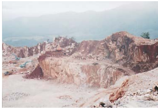
Rajah 3.3 Kuari Perak Hanjoong Simen Sdn. Bhd.

Kuari PHS terletak di bahagian puncak Gunung Pondok dimana ia bersebelahan dengan kilang pemprosesan simen. Merupakan kuari jenis Hill Site Quarry disebabkan oleh kedudukannya di puncak gunung. Gambaran mengenainya ditunjukkan dalam Rajah 3.3.