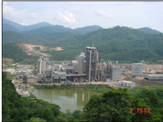
Rajah 3.1 Pemandangan Perak Hanjoong Sdn. Bhd.