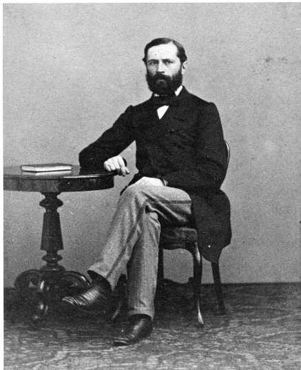
Afb. 3: E.J.J.B. Cremers, Nederlandse minister van Buitenlandse Zaken van maart 1864 tot juni 1866.

onafhankelijkheid te pleiten. Oostenrijk en Pruisen waren namelijk niet van plan om de Duitse banden met Limburg te verbreken, omdat de grote mogendheden wel iets anders aan hun hoofd hadden: de onbuigzaamheid van Kopenhagen. 96 Pas in 1867 kwam er een definitief einde aan de halfslachtigheid waarin de Nederlandse provincie Limburg verkeerde. Door het Verdrag van Londen werden de Duitse banden verbroken en had het geen dubbele staatkundige positie meer. Dit wordt door historicus M.G. Spiertz gezien als een groot voordeel voor Nederland, omdat Limburg in het volgende Europese conflict, de Frans-Duitse oorlog in 1870-1871, niet meer gedwongen kon worden om troepen te leveren. Hierdoor kon de Nederlandse afzijdigheidspolitik niet meer in gevaar komen. 97