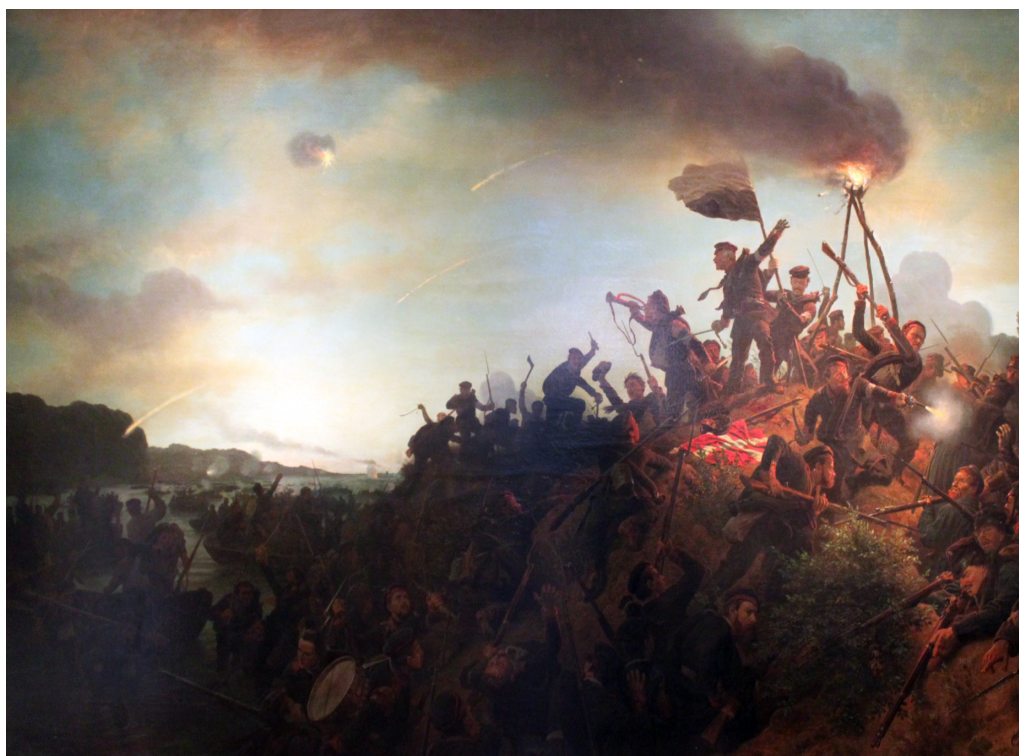
Afb. 1: De bestorming van Als door het Pruisische leger tijdens de Deens-Duitse oorlog in de zomer van 1864, door Wilhelm Camphausen (1866).