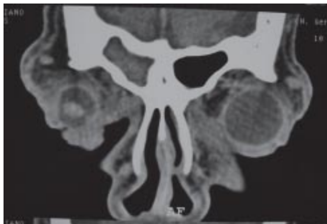
Foto 2. Velamento do seio frontal direito