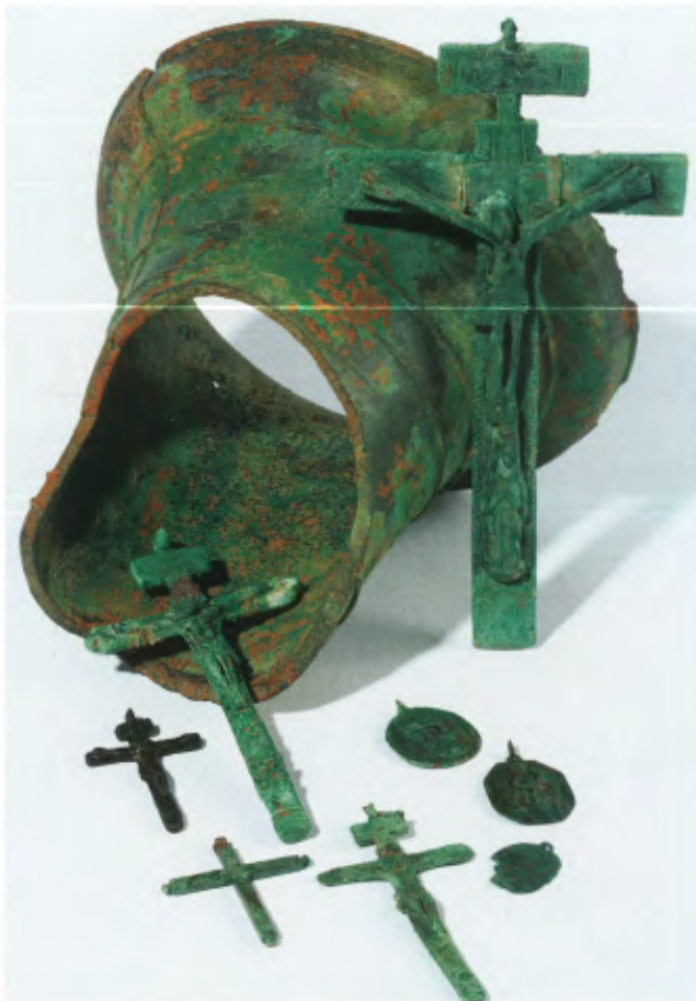
De klok samen met de kruisbeelden en het medaillon gevonden in een graf