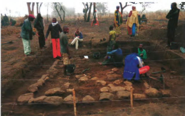
Archeologen graven de fundering van het kleine gebouw ten zuiden van de kerk op

Mbanza Kongo bestond het rijk uit verschillende provincies.