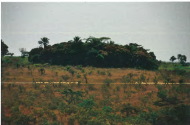
Ngongo Mbata, de heuvel waarop ooit een christelijke kerk stond