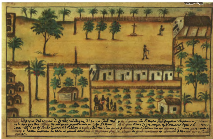
Aquarel van de missiepost in Mbanza Soyo in de 18de eeuw uit het manuscript van Bernardino Ignazio da Zezza d'Asti

archeologie om de oorsprong en de vroege geschiedenis van het Koninkrijk Kongo beter te begrijpen. Archeologische gegevens laten toe historische informatie uit verschillende bronnen te toetsen. Een belangrijke rol is dus weggelegd voor plaatsen als Ngongo Mbata, dat vanaf de late 16de eeuw in verschillende documenten vermeld werd en ook voorkomt op 17de-eeuwse kaarten.