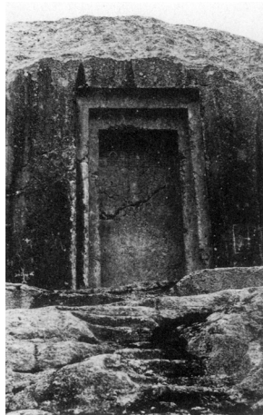
Afbeelding 2. Urartische cultus-nis Taş-Kaptı in Yeşilaltı (bron: Işik 1987, plate XXXIVb).

Dat Urartu culturele invloed had op de Phrygiërs is niet verwonderlijk. Urartu was gekend voor zijn handelscontacten tot in Etrurië, wat uiteraard een