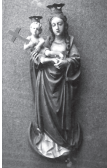
Het Mariabeeld met Kind op een maansikkel.

In de kapel staat een lief Mariabeeldje, waar vroeger het jaartal 1628 op geschilderd was. Men kan zich de vraag stellen wat er bij iedere verbouwing gebeurde met de arduinen steen en het opschrift dat erin gebeiteld staat. Werd er telkens op gelet dat wel dezelfde tekst en hetzelfde jaartal weergegeven werden?