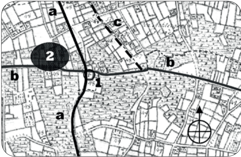
Kruipendaarde op de Ferrariskaart: 1. kapel; 2. situering van Algoets bezittingen; a. huidige weg-tracé Ardooie (N) - Izegem (Z); b. weg Roeselare (west) - Meulebeke (oost); c. huidige Bruinbergstraat.

De kapel kan echter best teruggaan op een oudere devotie. De Flou vermeldt in die omgeving onder Kachtem een Bruunberchkruis en een Brunecruce met citaten vanaf de 15de eeuw 61 . Het leen dat Algoet van de heerlijkheid Rodes hield, wordt in 1626 en 1680 zelfs uitdrukkelijk gesitu-