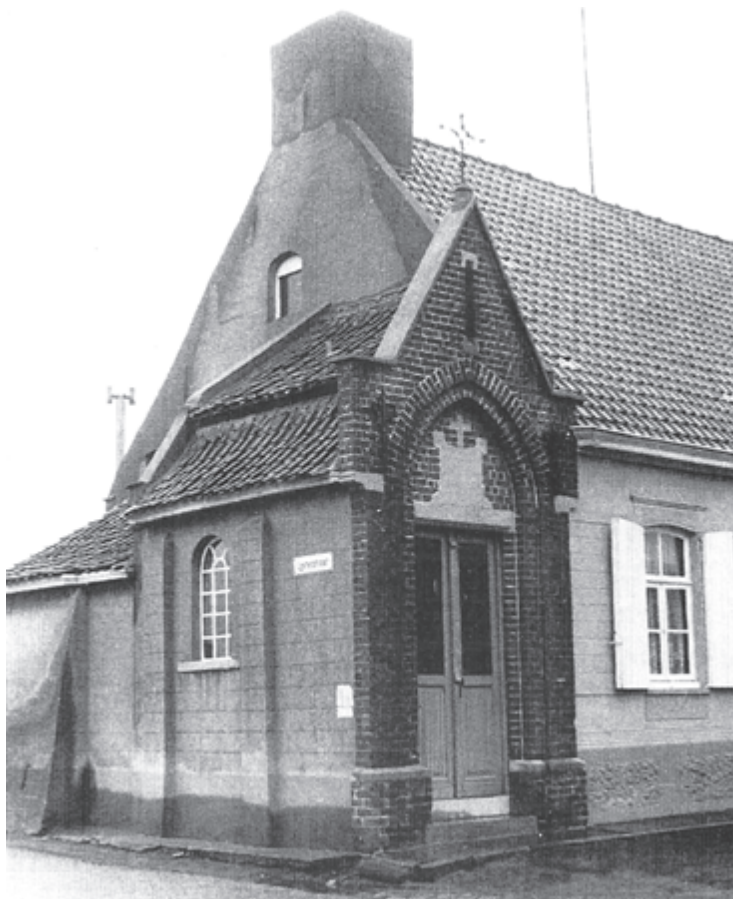
De kapel van Kruipendaarde, toestand voor 1988. Uit: M. VERSTRAETE, 'Kruipendeerde, waarheid en verzinsels', in: Ten Mandere , 36 (1996), p. 13.

aan zijn (vroegere) generaal en weer in het reguliere leger opgenomen werd. Beide auteurs, die afkomstig waren uit de onmiddellijke omgeving van het gehucht Kruipendaarde, zullen dit verhaal, dat toen reeds minstens twee eeuwen oud was, gehoord hebben van mensen die ter plaatse woonden