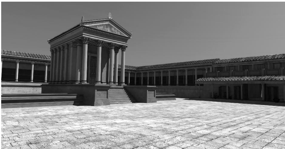
Fig. 2. Ammaia , Alto Alentejo (Portugal). 3D virtual reconstruction of the northern part of the forum square, with the temple flanked by the two hypothesized water basins (reconstruction by M. Klein, 7Reasons Media Agency).

This “irregularity” can be explained by the fact that the two neighbouring blocks of the central rows “contain” centrally the forum building. Built on a terrace, sustained on the eastern side by a cryptoporticus , functional to compensate the gradient of the slope, the forum, very partially known thanks to excavations, is now totally reconstructed on the basis of the geophysical survey 6 integrated with some ground-truthing excavations, carried out during the campaigns 2010 and 2011. It turned out to be a typical tripartite forum, with the “sacred” sector, constituted by a temple (probably capitoline), and the basilica opposite the central square. The sector behind the temple is surrounded by a portico, while the two sides of the square are bordered by rows of seven tabernae on each side. The whole complex measures 88 by 65m. The stratigraphical excavations have disproved the original hypothesis that the “sacred” sector of the complex was raised above the level of the square, while it is suggested now to locate at least one (but most probably a symmetrical second) water basin on the side of the forepart of the podium, flanking the monumental staircase. The provisional reconstruction of this area gives an idea, but still needs minor adaptations. (Fig. 2)