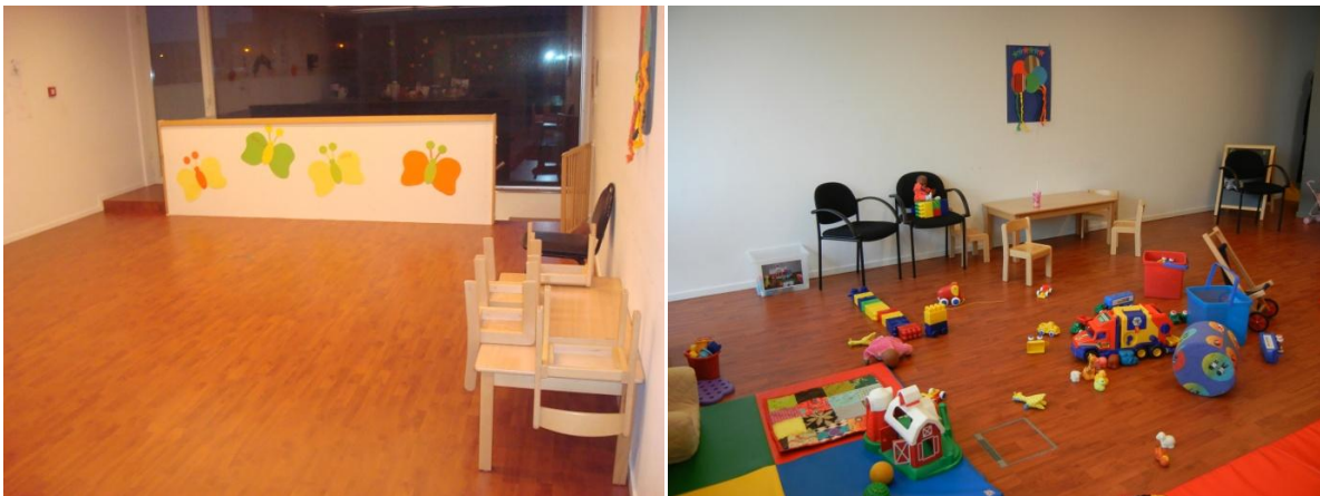
Foto: De Speelbabbel Luchtbal 'voor' en 'tijdens' ontmoetingsmoment

Wanneer ontmoetingsmomenten plaatsvinden in een consultatieruimte van Kind & Gezin of een kinderdagverblijf wordt de ruimtelijke indeling ervan voor aanvang van het openingsmoment volledig gewijzigd om dat welkomstgevoel te installeren.