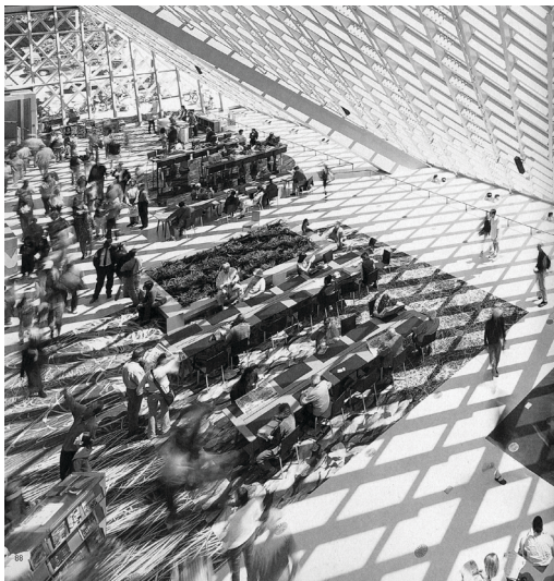
Afbeelding 2 - Seattle Public Library

schermen staren hetzelfde als samen boeken lezen? Aangezien virtualiteit overal en nergens is, en dus loskomt van enige specifieke plek, vernietigt de bibliotheek dan niet haar eigen bestaansrecht? En naarmate meer en meer