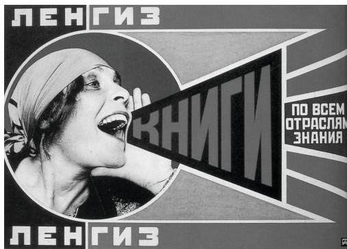
Alexander Rodchenko, Affiche, 1924

Zelfs op het ogenblik van de meest radicale en revolutionaire maatschappelijke vernieuwingen van de vorige eeuw is het belang van boeken niet in vraag gesteld. Integendeel: de bekende affiche die Alexander Rodchenko in 1924 maakte voor een Moskouise uitgever toont het belang van boeken voor de Russische revolutionairen en avant-gardes. Lilya Brik, Vladimir Mayakovsky's muze, schreeuwt, met duidelijk plezier, haar nood en geloof uit: 'BOEKEN!'