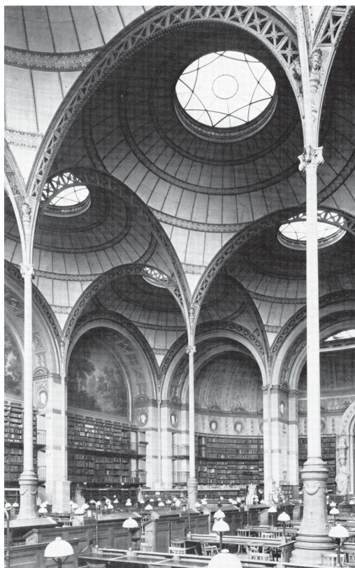
Afbeelding 1 - Bibliothèque Nationale Paris

Vandaag de dag is de typologie van de bibliotheek een typologie in crisis. Louter beschouwd vanuit de factoren vorm en functie lijkt er weinig fundamenteel aan de hand. Vormelijk is de bibliotheek wel gewijzigd, het is zo dat ze haar 'tempelachtige' verschijning heeft ingeruild voor een 'modernere', toegankelijke en transparantere uitstraling. Maar haar architecturale vorm wijzigde al veelvuldig in haar bestaansgeschiedenis, dit heeft echter nog nooit veranderd wat ze is . Haar functie is ook gaan transformeren. Ze is heel wat nieuwe media en programmadelen in zich beginnen opnemen, die haar vroeger vreemd waren. Maar ondanks