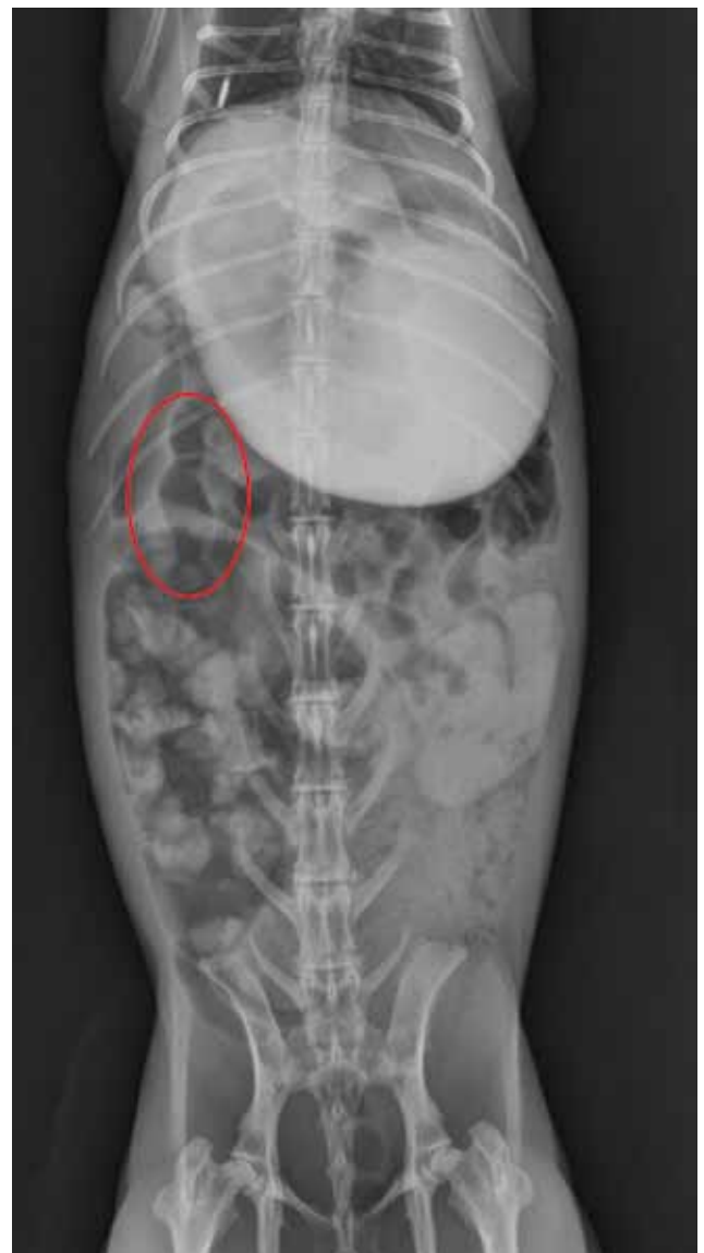
Figuur 4. Ventrrodorsale opname van het abdomen 120 minuten na het geven van de contrastvloeistof, 10 ml iodixanol (Visipaque®). De contrastvloeistof is nog duidelijk zichtbaar in de gedilateerde maag, maar ook al focaal in de dunne darm. 'Cobrahoofdjes' zijn zichtbaar in de dunne darmen (rode cirkel). Ze wijzen op peristaltiek.

Echografie is meestal niet diagnostisch bij gastro-intestinale problemen wegens de hoeveelheid gas