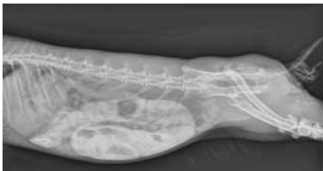
Figuur 5. Links-rechts laterale opname de dag na de toediening van 7 ml contraststof (Visipaque®) per os bij een konijn met ileus en erge tympanie. De maag is gevuld met inhoud. De darmen zijn gedilateerd maar gevuld met inhoud en diffuus zijn er wat resten van contrastvloeistof zichtbaar. Ook is er nog gas zichtbaar in de darmen. Dit röntgenbeeld toont dat er passage is in het maagdarmstelsel.

len van andere oorzaken van de obstructie, zoals een tumor of intussusceptie. Zodoende heeft de patiënt afhankelijk van de ernst van zijn toestand een redelijke kans op herstel (Harcourt-Brown, 2002b). Chirurgie bij een patiënt in slechte toestand heeft een slechte kans op herstel (Schnabl et al., 2009). Als het konijn niet chirurgisch behandeld wordt, is er enkel kans op herstel als het voorwerp toch in het colon kan komen door conservatieve therapie (Harcourt-Brown, 2007b). In het geval dat de obstructie veroorzaakt wordt door een haarbal is conservatieve behandeling enkel mogelijk als het dier nog in goede conditie is en er dient na 72 uur een opvolgingsfoto genomen te worden om te zien of de behandeling effect heeft gehad (Harcourt-Brown, 2007b; Schnabl et al., 2009) (Figuur 5).