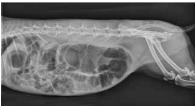
Figuur 1. Links-rechts laterale opname van het abdomen van een konijn met erge ileus en tympanie. Er is een grote hoeveelheid gas zichtbaar in het maagdarmstelsel, vooral in het colon en caecum. Lokaal zijn er kleine hoeveelheden inhoud zichtbaar, wat te verklaren is door het dwangvoederen.

Epizoötische enteropathie bij het konijn is een ziekte die gekarakteriseerd wordt door grote hoeveelheden mucus in het colon (Harcourt-Brown, 2002a; Krogstad en Dixon, 2003). Clostridium spiroforme en Clostridium perfringens zijn er vaak maar niet altijd mee geassocieerd. De mortaliteit is hoger bij natuurlijk aangetaste konijnen dan bij SPF-dieren, wat suggereert dat secundaire infecties een rol spelen (Marlier et al., 2006). Vaak treedt er impactie van het caecum op met in een later stadium dilatatie van maag en duodenum (Licois, 2005; Marlier et al., 2006). Bij sommige uitbraken wordt dysautonomie vastgesteld (Whitwell en Needham, 1996). Respiratoire symptomen kunnen aanwezig zijn naast anorexie, abdominale distensie, abnormale fecesproductie en depressie (Harcourt-Brown, 2002a). In het begin is er soms diarree, later is er mucusexcretie met of zonder fecaal materiaal en uiteindelijk is er helemaal geen productie meer (Licois et al., 2005). De aandoening komt meestal voor bij jonge en in groep gehouden konijnen, maar soms ook bij volwassen konijnen (Harcourt-Brown, 2002a; Licois et al., 2005).