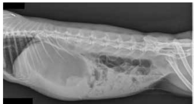
Figuur 2. Links-rechts laterale opname van het abdomen van een konijn verdacht van gastro-intestinale obstructie. Er is een sterk gedilateerde maag met voornamelijk vloeibare inhoud zichtbaar, alsook een ileusbeeld met voornamelijk gas in de dunne darmen.