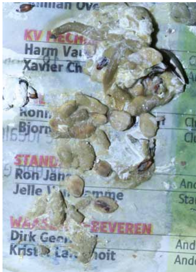
Figuur 1. Een groot aantal onverteerde zaden in de mest van een rosé kaketoë ( Eolophus roseicapillus ) met kliermaagdilatatiesyndroom.

Het kliermaagdilatatiesyndroom (KDS) veroorzaakt door aviair bornavirus (ABV) is een fatale neurologische aandoening die voornamelijk bij psittaciformen vastgesteld wordt (Guo et al., 2014; Hoppes et al., 2010 en 2013; Rubbenstroth et al., 2012). Tot op heden werden KDS en ABV-infectie bij meer dan tachtig soorten psittaciformen beschreven (Hoppes et al., 2013). Er wordt aangenomen dat wilde vogels als reservoir van ABV kunnen fungeren (Berg et al., 2001). KDS is ook bekend als ‘macaw wasting disease’ aangezien de aandoening voor de eerste maal beschreven werd in het begin van de jaren zeventig van de vorige eeuw bij ara's die vanuit Boliviaë naar Europa en Noord-Amerika geïmporteerd werden (Hoppes et al., 2010). Ondertussen wordt KDS wereldwijd vastgesteld. De kliermaagdilatatie die bij klinisch geïnfecteerde vogels gezien wordt, is het gevolg van virus-geïnduceerde, immunologische schade ter hoogte van het autonome, gastro-intestinale zenuwstelsel (Gancz et al., 2010; Hoppes et al., 2013). De meest voorkomende symptomen die optreden ten gevolge van deze lymfoplasmocytair ganglioneuritis met dilatatie van de kliermaag zijn regurgitatie, kropstase, gewichtsverlies met dikwijls opvallende atrofie van de pectoraalspieren en maldigestie met eventuele aanwezigheid van onverteerde zaden in de mest (Hoppes et al., 2010) (Figuur 1). De ziekte kent veelal een chronisch verloop en wordt uiteindelijk