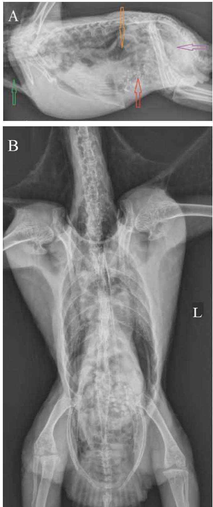
Figuur 3. Laterale (A) en ventrodorsale (B) opname van het coelom van een edelpapegaai ( Ecliptes roratus ). A. De krop is gevuld met gas (groene pijl). De proventriculus is gedilateerd (ratio 0,94) en gevuld met gas (oranje pijl). De ventriculus bevat grit en gas (rode pijl). Veralgemeende dilatatie van de darmen en aanwezigheid van een matige hoeveelheid gas (paarse pijl).