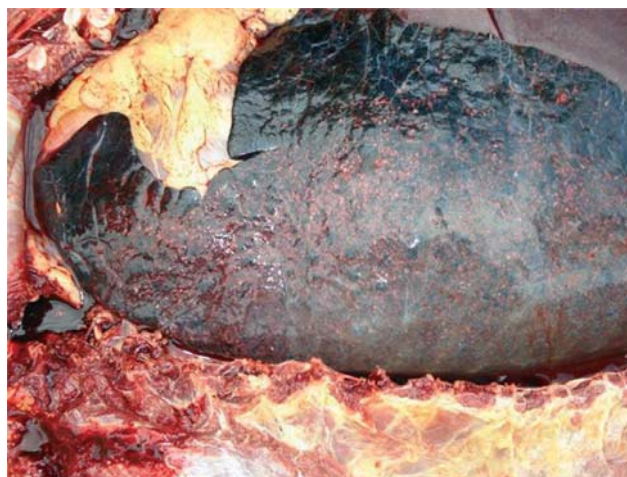
Figuur 1. Autopsie van de long: alveolaire bloeding in de longen van een twee maanden oud veulen.

De sterk verhoogde nierwaarden, samen met de ern-